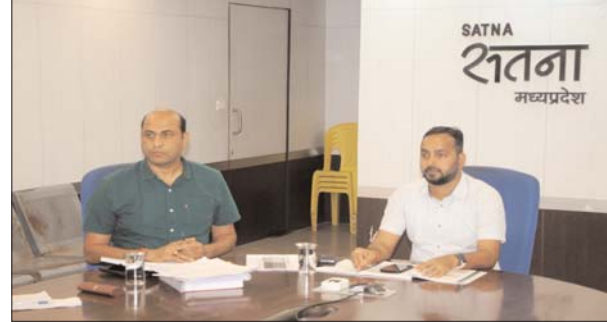
नामांकन पत्र के साथ दखिल उम्मीदवार के शपथ पत्र को उसी दिन सूचना पटल पर प्रकाशित कराना। सभी रिटर्निंग आफीसर नामांकन पत्र अर्नालाइन दर्ज करने के लिए अलग से कर्मचारी तैनात करेंगे। नामांकन पत्रों के दखिल होने की पूरी जानकारी प्रतिदिन जिला निर्वाचन कार्यालय को अनिवार्य रूप से उपलब्ध कराएंगे। कलेक्टर ने कहा कि नामांकन पत्र दखिल करने के स्थल पर निरीक्षण रशि जमा करने की समुचित व्यवस्था रखें। इस बार निरीक्षण रशि एम्पटीसी से नहीं जमा

की जायेगी। अभ्यर्थी को नामांकन नवीन संशोधित फॉर्म-26 में शपथ पत्र के साथ भरना होगा। न्हेन कहा कि नामांकन पत्र में प्रारंभिक तौर पर किसी तरह की कमी दिखाई देने पर उसकी