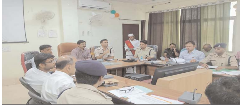
लगातार तैनात रहेंगे। सभी सर्विलांस टीम और एफएसटी टीम के साथ संयुक्त रूप से कार्रवाई भी करें और निरंतर जांच भी करते रहें। कहीं भी कोई भी यदि ऐसी घटना संज्ञान में आती है तो उसके लिए तुरंत ही अपने वरिष्ठ अधिकारियों को घटना के संबंध में सूचित करें। यह सुनिश्चित करें कि सभी

केंद्रों पर सीसीटीवी लगाए जायेंगे। जिनकी कंट्रोल रूम से मॉनिटरिंग भी की जाएगी। इससे किसी भी विधानसभा क्षेत्र में यदि कोई घटना हो रही है तो उसके संबंध में जानकारी सभी लोगों को संयुक्त रूप से सूचना उपलब्ध हो जाए जिससे कि अन्य विधानसभा में भी जरूरी आवश्यक कदम उठाए जा सकें। जिला निर्वाचन अधिकारी ने कहा कि भिण्ड जिले में निष्पक्ष रूप से शांतिपूर्ण और पारदर्शी के साथ चुनाव कराना हम सभी की प्राथमिकता है इसके लिए हमें जो भी आवश्यक कदम उठाने होंगे उसको अनिवार्य रूप से उठाए जाएंगे। सभी विधान सभा क्षेत्र में समय-समय पर फ्लैग मार्च किया जाए और मतदाताओं में आत्मविश्वास जगाने के लिए लगातार सतत रूप से संपर्क बनाए रखा जाए। मतदान प्रतिशत बढ़ाने के लिए जिले के सभी विभागीय अधिकारियों को अलग-अलग ब्यूचर पर तैनात किया गया है जिससे वह वहां के मतदाताओं से संवाद स्थापित करेंगे और मतदान प्रतिशत बढ़ाने के लिए आवश्यक उपाय करेंगे पुलिस अधीक्षक असित यादव ने कहा कि पुलिस अधिकारी भी