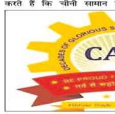
खरीदें। खड्डेवाल ने कहा कि रक्षा बंधन से शुरू हुए त्योहारी सीजन में लगभग 3 लाख करोड़ रुपये उसके तुरंत बाद शादियों के सीजन में लगभग 4.25 लाख करोड़ रुपये एवं तत्पश्चात् सीखे क्रिसमस एवं नव वर्ष पर करीब 1.25 लाख करोड़ रुपये के देशभर में व्यापार के अनुमान के अनुसार यह आंकड़ा भारत के

देश के बाजारों में 31 दिसंबर तक 8.5 लाख करोड़ रुपये का होगा व्यापार : कैट