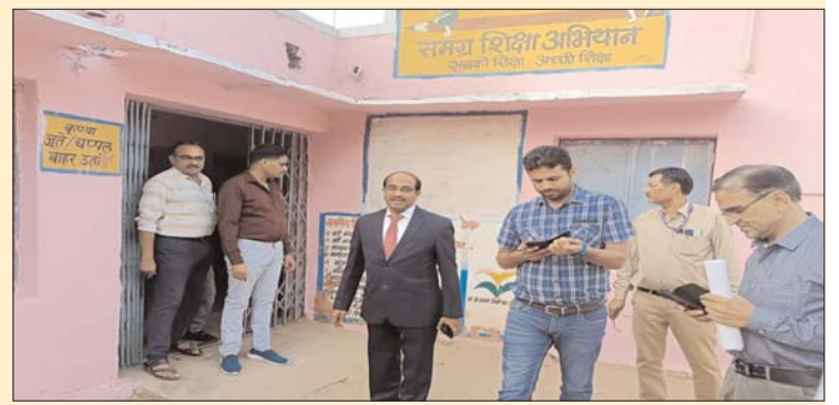
231, 232, 233, आइटीबीपी हाई स्कूल संस्कृत विद्यालय करैरा का निरीक्षण किया। पेयजल विद्युत व्यवस्था सहित मतदान केन्द्रों में अन्य व्यवस्थाएं देखी। इस दौरान अन्य अधिकारी भी उपस्थित रहे। उन्होंने पोहरी विधानसभा क्षेत्र के माध्यमिक विद्यालय कृष्णगंज के मतदान केंद्र 132 व 134 एवं शासकीय कन्या उच्चतर माध्यमिक विद्यालय पोहरी के मतदान केंद्र 136 व 130 का निरीक्षण किया।

अनिल कुशवाह पुष्पांजलि टुडे शिवपुरी- विधानसभा क्षेत्र 23 करैरा और 24 पोहरी के लिए डॉ.एस.नटराजन को सामान्य प्रेक्षक नियुक्त किया गया है। सामान्य प्रेक्षक डॉ.एस नटराजन ने शिवपुरी पहुंचकर विधानसभा क्षेत्र करैरा और पोहरी का भ्रमण किया। दोनों विधानसभा क्षेत्र में मतदान केंद्रों का भ्रमण किया। रिटर्निंग अधिकारी कार्यालय में नामांकन फार्म जमा करने की प्रक्रिया देखी। उन्होंने मतदान केंद्रों की मूलभूत व्यवस्थाओं की जानकारी ली। प्रेक्षक डॉ.एस.नटराजन ने करैरा के मतदान केंद्र क्रमांक