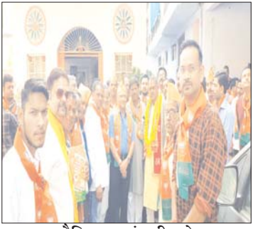
दैनिक पुष्पांजली टुडे ग्वालियर। ग्वालियर दक्षिण विधानसभा से