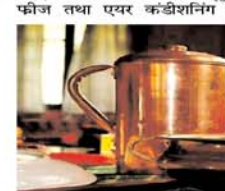
लिफ्ट इस्तेमाल होने वाली ताबे की ट्यूब भी इसके तहत आती है। विभाग ने कहा, 'घरेलू लघु/सूक्ष्म उद्योगों की सुरक्षा के लिए, ब्यूसीटी गुणवत्ता नियंत्रण आदेश को सुचारू क्रियान्वयन, व्यापार करने में आसानी को सुनिश्चित करने के लिए, लघु/सूक्ष्म उद्योगों को समर्थनीय के संबंध में छूट दी गई है, लघु उद्योगों को अतिरिक्त तीन महीने और सूक्ष्म उद्योगों को अतिरिक्त छह महीने का समय दिया गया है।' इसी तरह इम और टिन का उपयोग मूल रूप से कई अलग-अलग प्रकार के जहरीले,

आदेशानुसार, बीआईएस और इलेक्ट्रॉनिक्स कंपनियों को अधिसूचित करने के लिए प्रमुख उत्पादों की पहचान कर रहे हैं। इसके तहत 318 उत्पाद मानकों को कवर करने वाले 60 से अधिक नए ब्यूसीटी को तैयार करना शुरू किया गया है। बीआईएस अधिनियम के प्राधान्य को उल्लंघन करने पर पहली बार अपराध करने पर दो साल तक की कैद या कम से कम दो लाख रुपये का जुर्माना हो सकता है। दूसरी बार और उसके बाद के अपराधों पर जुर्माना बढ़कर न्यूनतम पांच लाख रुपये हो जाएगा और माल या वस्तुओं के मूल्य के 10 गुना तक बढ़ जाएगा। उद्योगिकताओं और निर्यातकों के बीच गुणवत्ता संवेदनशीलता विकसित करने के लिए विभाग द्वारा ब्यूसीटी के विकास सहित विभिन्न पहल की जा रही है।