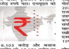
18,103 करोड़ और बजाज फाइनेंस को 17,171 करोड़ का घाटा हुआ। एसएमई: 3540 करोड़ रुपये घुटाए एसएमई कंपनियों ने आईपीओ के जरिये इस साल में अब तक 3,540 करोड़ रुपये जुटाए हैं। कुल 139 आईपीओ

नई दिल्ली। अमेरिकी बॉन्ड की ब्याज दरें बढ़ने और इस्राइल-इरान युद्ध के कारण विदेशी निवेशकों ने इस महीने में अब तक इकट्ठी बाजार से 12,146 करोड़ रुपये निकाले हैं। इन निवेशकों ने सितंबर में भी 14,767 करोड़ रुपये की निकासी की थी। हालांकि, डेट बाजार में इन्होंने 5,700 करोड़ रुपये का निवेश किया है। इस साल मार्च से अगस्त तक विदेशी निवेशकों ने भारतीय शेयर बाजार में 1.74 लाख करोड़ रुपये के शेयर खरीदे थे। शीर्ष 10 कंपनियों के 1.52 लाख करोड़ रुपये डूबे शेयर बाजार में मुचीबद्ध शीर्ष 10 कंपनियों के बाजार पूंजीकरण में पिछले हफ्ते 1.52 लाख करोड़ रुपये की कमी आई है। इस दौरान सबसे कम 885 अरब डॉलर की गिरावट आई थी। सबसे ज्यादा 34,877 करोड़ रुपये का नुकसान रिलायंस इंडस्ट्रीज की हुआ है। टाटा कंसेल्टेंसी सर्विसेस का बाजार पूंजीकरण 27,827 करोड़ रुपये घटा। एचयूएल को 18,103 करोड़ और बजाज फाइनेंस को 17,171 करोड़ का घाटा हुआ। एसएमई: 3540 करोड़ रुपये घुटाए एसएमई कंपनियों ने आईपीओ के जरिये इस साल में अब तक 3,540 करोड़ रुपये जुटाए हैं। कुल 139 आईपीओ