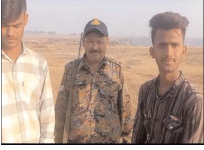
दैनिक पुष्पांजली टुडे पुष्पेंद्र सिंह ब्यूरो चीफ मरुगंज

बहुती प्रताप घूमने गए दो युवक घने जंगल में रात भर भटकते रहे देर रात से नईगढ़ी थाना पुलिस के दो जवान जंगल में भटकते हुए दोनों युवकों को निकलने में लगे हैं। लेकिन रात में सफलता नहीं मिली है। करीब 7 घंटे का समय गुजर चुका है अभी तक नहीं पहुंची आपदा प्रबंधन टीम। घने जंगल में