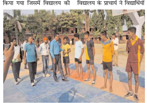
किया गया जिसमें विद्यालय की विद्यालय के प्राचार्य ने विद्यार्थियों जानकारी दी। इसी तरह हायर सेकेण्डरी स्कूल तिवारा, मझगावां, खड्डा, रायपुर सोनरी, उच्चतर माध्यमिक विद्यालय बुदामा, हाई स्कूल अमिलिया, बालक हायर सेकेण्डरी चाकघाट, हाई स्कूल चौराबारी एवं मझगावां, कन्या हायर सेकेण्डरी स्कूल मऊगंज एवं भमरा में मानव श्रृंखला बनाकर मतदाता जागरूकता का संदेश दिया गया। मांडल स्कूल मऊगंज एवं सीएम राइज स्कूल देवतालाब में स्वीप कार्यक्रम के तहत वाद-विवाद प्रतियोगिता का आयोजन कर विद्यार्थियों को मतदान के महत्व के विषय में जागरूक किया गया।

पुष्पांजली टुडे रीवा। विधानसभा निर्वाचन 2023 में जिले में मतदान का प्रतिशत बढ़ाने के उद्देश्य से मतदाताओं को मतदान करने के लिए जागरूक करने हेतु जागरूकता अभियान संचालित किया जा रहा है। कलेक्टर एवं जिला निर्वाचन अधिकारी के मार्गदर्शन में स्वीप की विभिन्न गतिविधियों का जा रही है। मतदाता जागरूकता अभियान के तहत शासकीय उच्चतर माध्यमिक विद्यालय बड़ी हदों में खेल एवं युवक कल्याण विभाग के सहयोग से कबड्डी प्रतियोगिता का आयोजन