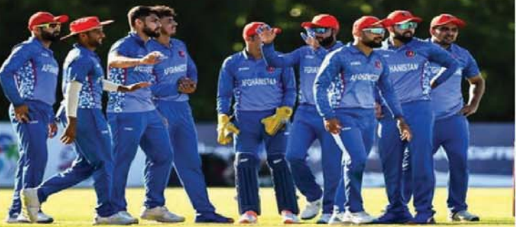
खिलाड़ी विश्व कप में प्रतिस्पर्धा कर रहे हैं, वे इस तरह खेलते हुए खिताब जीत सकते हैं। उन्होंने रोहित शर्मा की टीम से आग्रह किया कि वे नकारात्मक विचारों से बचें। रिचर्ड्स ने कहा कि बहुत सारे प्रतिभाशाली खिलाड़ी आए हैं लेकिन उनमें सबसे ऊपर आप विराट कोहली को ही पाएंगे। उन्होंने कहा कि मैं विराट का बहुत बड़ा प्रशंसक हूँ, मैं लंबे समय से हूँ, और अब भी यह दिखा रहा है कि क्यों उसे महान सचिवन जैसे सर्वकालिक महान खिलाड़ियों में से एक के रूप में जाना जाता है। कोहली जब 1,021 दिन तक शतक नहीं लगा पाए तो आलोचकों ने कहा कि उनके सुनहरे दिन पीछे छूट गए हैं। लेकिन यहाँ विश्व कप में उन्होंने शानदार फॉर्म दिखाई है जिससे यह विश्वास पैदा हुआ है कि महेंद्र सिंह धोनी के नेतृत्व में 2011 की सफलता के बाद भारत इस प्रतिष्ठित ट्रॉफी को दोबारा जीत सकता है।

हैं' और 'उन खिलाड़ियों में से एक हैं जिनके पास सभी बड़े शॉट हैं। उन्होंने कहा कि जिस तरह की 'मानसिकता' के साथ भारतीय मन में लाना बंद करें कि एक खराब मैच सामने आ सकता है। रिचर्ड्स का मानना है कि पाकिस्तान अब भी सेमीफाइनल तक पहुंचने का सपना देखते हुए उन्हें पहले ही अपना स्थान पक्का कर लेना चाहिए था। उन्होंने कहा कि उन्होंने अपने लिए चीजों को कठिन बना लिया है - मुझे लगता है कि वे तालिका में अपनी स्थिति से कहीं अधिक प्रतिभाशाली टीम हैं।