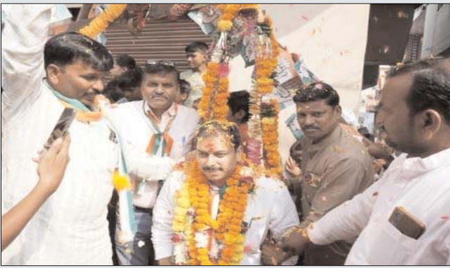
पाठक ने लोगों से कांग्रेस पार्टी को वोट करने की अपील करते हुए कहा कि प्रदेश

कई कल्याणकारी योजनाएं शुरू करने के बारे में बताते हुए कहा कि नारी सम्मान योजना के तहत महिलाओं को प्रतिमाह 1500 रुपए दिए जाएंगे, सिलेंडर जो अभी लगभग 1200 में मिल रहा है वह 500 में दिया जाएगा, सामाजिक सुरक्षा पेंशन को भी डबल करते हुए 600 से 1200 रुपए कर दिया जाएगा। बिजली का बिल भी 100 यूनिट तक मुफ्त एवं 200 यूनिट तक आधा किया जाएगा। इसके साथ-साथ स्वास्थ्य बीमा जैसी महत्वपूर्ण योजनाओं के अलावा युवाओं, बुजुर्गों, महिलाओं, कर्मचारियों एवं अन्य लोगों के लिए भी कई क्रांतिकारी योजनाएं लागू की जाएंगी। विधायक