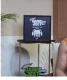
मैं फिल्म बनाने के सौभाग्य और एक महिला के रूप में दूसरों की प्रेरणा में योगदान देने के गौरव को स्वीकार किया। मैरी कॉम ने आगामी पेरिस ओलंपिक के लिए भारतीय एथलीटों की उपलब्धियों पर प्रकाश डाला और भारतीय

नई दिल्ली। महान भारतीय महिला मुक्केबाज और छह बार की विश्व चैंपियन मैरी कॉम ने रणवीर अल्लाहबादिया के पांडकास्ट श्रृंखला के एक एपिसोड में अपने शानदार करियर और जीवन के बारे में रोचक जानकारी साझा की। पांडकास्ट में मैरी कॉम ने अपनी अनेखी जिंदगी की परते खोलीं। बातचीत में उनकी यात्रा के आध्यात्मिक पहलू पर चर्चा हुई। मैरी कॉम ने खुलासा किया कि वह खुद को ईश्वरीय प्रेरणा से तैयार एक फाइटर मानती हैं। साथ ही उन्होंने जीवन की बाधाओं का सामना करते हुए निडर होकर, समाज की भलाई में योगदान देने की उत्सुकता व्यक्त की। पांडकास्ट में मैरी कॉम के जीवन के विभिन्न पहलुओं को छुआ, जिसमें उन पर हलिया