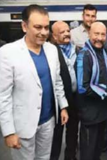
अनुसार लीजेन्ड्स लीग क्रिकेट की यह ट्रॉफी 17 विभिन्न राज्यों और केन्द्र शासित प्रदेशों से होकर