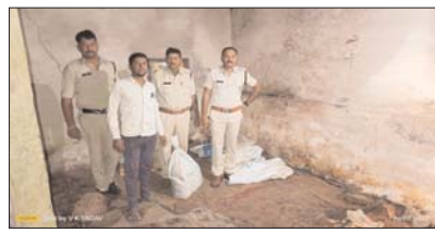
(जो की अवैध मदिरा मदिरा को अधिक