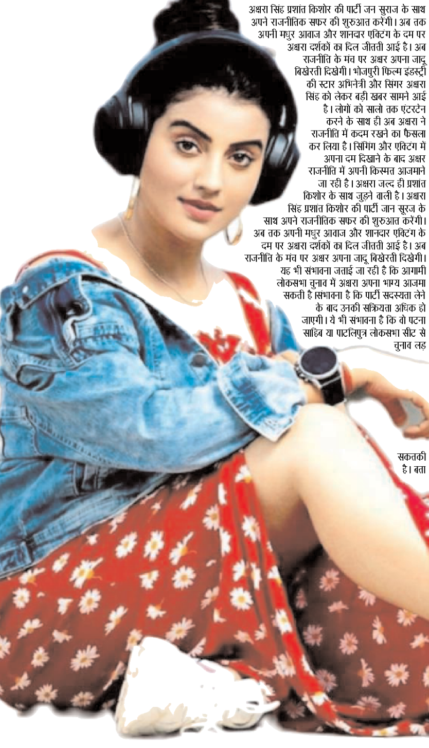
सकतकी है। बता

एनिमल हवअपमरू बॉलीवुड एक्टर रणबीर कपूर की फिल्म 'एनिमल' इस साल 2023 की मोस्ट अटेंडेड फिल्म है। कबीर सिंह फेम डायरेक्टर सदीप रेड्डी वांगा की अपकमिंग डायरेक्शनल 'एनिमल' को लेकर काफी बज भी बना हुआ है। बीते दिन फिल्म का ट्रेलर रिलीज किया गया,जिसे फैंस की एवसाइटमेंट बढ़ा दी है। सभी इस फिल्म की रिलीज का बेसब्री से इंतजार हो रहे हैं। इसी बीच फिल्म को लेकर फैंस के बीच एक नई बहस शुरू हो गई है। कोई फिल्म का जमकर समर्थन कर रहा है, तो फिल्म की कहानी को अक्षय कुमार और अमिताभ बच्चन की फिल्म की कीर्ती बताया रहा है। बॉलीवुड एक्टर रणबीर कपूर की फिल्म 'एनिमल' इस साल 2023 की मोस्ट अटेंडेड फिल्म है। हाल ही में सोशल मीडिया पर 'एनिमल' के ट्रेलर से जुड़ा एक वीडियो वायरल हो रहा है। इस वीडियो में 'एनिमल' के साथ-साथ अक्षय कुमार और अमिताभ बच्चन की फिल्मों के सीन्स को भी लगाया गया है,जिसमें देखा जा सकता है कि रणबीर कपूर की तरह ही अक्षय कुमार भी बार-बार 'पापा' बोलते हुए नजर आ रहे हैं। इस वीडियो में अमिताभ और अक्षय की दो फिल्मों के सीन्स दिखाए गए हैं। जिनका नाम 'एक रिश्ता' और 'वक्त' है। इन दोनों फिल्मों की कहानी भी बाप-बेटे पर आधारित है। अब सोशल मीडिया पर इस वक्त से वीडियो खूब सुर्खियां बटोर रहा है। इस वीडियो के सामने आने के बाद जहां कुछ फैंस फिल्म