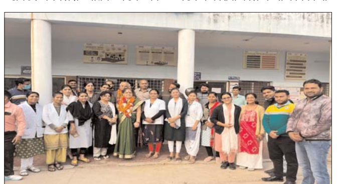
व्यवहार स्टाफ के साथ हमेशा मधुर रहा वह बहुत ही सराहनीय है उन्होंने अपनत्व