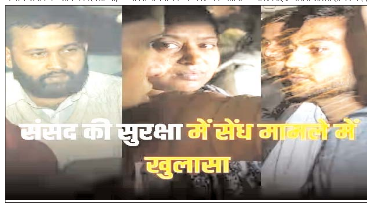
संसद की सुरक्षा में संध माना जा रहा है खुलासा

पूछताछ की जरूरत है. पुलिस ने उसकी 15 दिन की हिरासत मांगी थी.जांच से जुड़े दिल्ली पुलिस के एक अधिकारी ने पीटीआई से कहा, 'साजिश को अंतिम रूप देने से पहले उन्होंने (आरोपियों ने) कुछ ऐसे तरीके तलाशे थे जिनके जरिए वे प्रभावशाली तरीके से सरकार तक अपना संदेश पहुंचा सकें. आरोपियों ने सबसे पहले अपने शरीर को अग्निरोधक लेप से ढककर आत्मदाह करने पर विचार किया लेकिन फिर यह विचार बदल दिया.बता दें कि संसद की सुरक्षा में चूक के मामले पर कांग्रेस और बीजेपी के बीच आरोप-प्रत्यारोप देखा जा रहा है. शनिवार को कांग्रेस नेता राहुल गांधी ने टिप्पणी करते हुए केंद्र सरकार को निशाना बनाया और कहा कि घटना के पीछे देश में बेरोजगारी और महंगाई कारण है.राहुल गांधी के बयान पर बीजेपी के कई नेताओं ने पलटवार किया