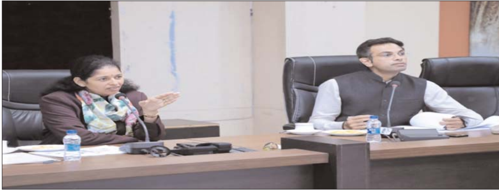
से उठाई जा रही धान की भी नियमित मॉनीटरिंग

पत्रक जारी करें जिससे सहकारी बैंक भुगतान की कार्यवाही कर सकें। अपर कलेक्टर, सभी एसडीएम तथा खाद्य विभाग के अधिकारी खरीदी केन्द्रों का नियमित रूप से निरीक्षण करें। धान खरीदी में किसी भी तरह की अनियमितता पाए जाने पर कड़ी कार्यवाही करें। उत्तरप्रदेश की सीमा से लगे खरीदी केन्द्रों में विशेष निगरानी रखें। किसी भी स्थिति में अन्य राज्यों की धान खरीदी केन्द्रों में नहीं आनी चाहिए। जांच नकों में वाहनों की कड़ी निगरानी रखें। कलेक्टर ने कहा कि अपर कलेक्टर प्रतिदिन धान की खरीदी, उठाव, परिवहन तथा किसानों को भुगतान का प्रतिवेदन प्रस्तुत करें। जिन समितियों में अधिक मात्रा में धान है वहाँ अतिरिक्त ट्रक लगाकर धान का परिवहन कराएं। मिलस द्वारा खरीदी केन्द्रों