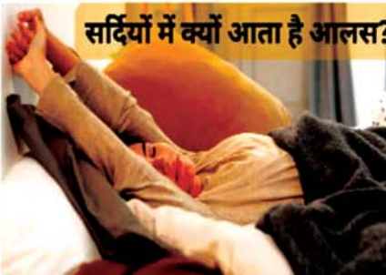
सर्दियों में क्यों आता है आलस?

सर्दियां आते ही अक्सर हमारा मन दिनभर कंबल में दबके रहने का करता है। इस मौसम सभी को सुस्ती छाई रहती है जिसकी वजह से कुछ भी करने का मन नहीं करता है लेकिन क्या आपने कभी यह सोचा है कि सर्दियों में मौसम में इतना आलस क्यों आता है। अगर नहीं तो आप इस आर्टिकल में हम आपको बताएंगे इसकी वजह और इससे निपटने के तरीकों के बारे में-