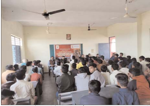
इस व्याख्यान माला में शिवाजी के जीवन और उनके संघर्ष के बारे में बतलाया गया कि कैसे उन्होंने मुगलों से युद्ध किये और एक हिन्दू साम्राज्य की स्थापना की उनके युद्ध कौशल और गोरिल्ला युद्ध नीति के बारे में भी बतलाया गया इन व्याख्यान