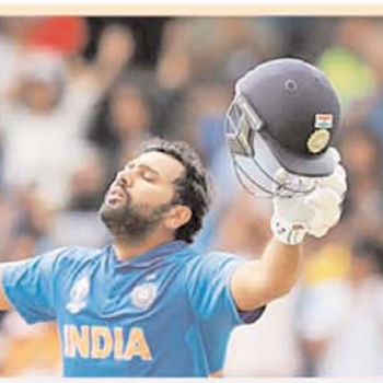
पहले सचिन तेंदुलकर, मोहं सिंह धोनी और विराट कोहली को यह अवार्ड मिल चुका है। तेंदुलकर पहले भारतीय क्रिकेटर थे, जिन्हें 1998 में खेल रत्न दिया गया था। धोनी को 2007 और कोहली को 2018 में वेटलिफ्टर मीराबाई चानू के साथ यह पुरस्कार मिला था। इससे पहले 2016 में बैडमिंटन खिलाड़ी पीवी सिंधु, जिमनास्ट दीपा कर्माकर, रेसलर साक्षी मलिक और शूटर जीतू राव को दिया गया था।