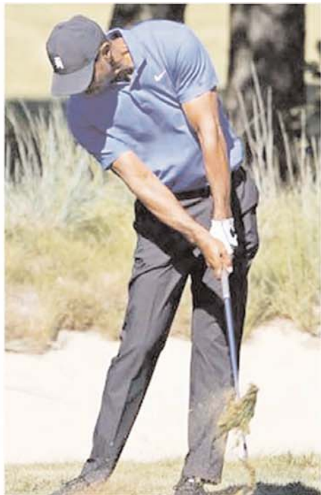
नॉर्टन में गोल्फर टाइगर वुड्स नार्थन ट्रस्ट गोल्फ में खेलते हुए।