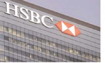
नई दिल्ली। एंजेसी एचएसबीसी बैंक ने भारत में अपने 'ग्रीन डिपॉजिट प्रोग्राम' लॉन्च किया। बैंक के इस युनिफ पहाल का उद्देश्य अक्षय ऊर्जा, क्लीन ट्रांसपोर्टेशन और अन्य 'ग्रीन-फ्रेंडली' पहल के लिए फायनेंस करना और उसे बढ़ावा देना है। ग्रीन डिपॉजिट प्रोग्राम की उल्लेखनीय विशेषता यह है कि, जो कॉर्पोरेट्स पर्यावरण संबंधित प्रोजेक्ट्स में निवेश करने का चाहते हैं उनके लिए खास 'ग्रीन डिपॉजिट प्रोग्राम' को मार्केट में लॉन्च किया गया है। भारत में 'ग्रीन डिपॉजिट प्रोग्राम' अपनी पहल का पहला और एकमात्र प्रोग्राम है।