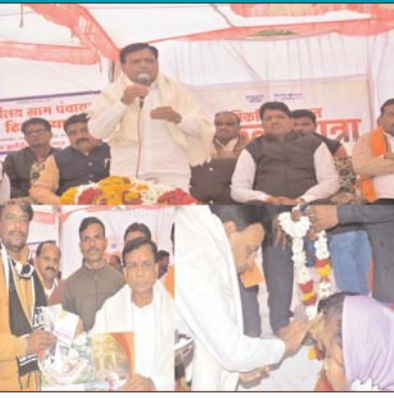
गरीब एवं पात्र व्यक्ति को शासन की योजनाओं का लाभ दिलाना तीर्थ यात्रा करवाने के समान है। हर कमजोर व्यक्ति का ध्यान सरकार रखती है। उसकी हर संभव सरकार मदद कर रही है। प्रधानमंत्री श्री नरेंद्र मोदी ने पूरे देश का विचार किया है, हर परिवार को शुद्ध पानी मिले। इसके लिए जल जीवन मिशन बनाया गया। इस मिशन से घर-घर में नल से पानी मिलेगा। आयुष्मान काई बनवाया गया। जिससे बीमार व्यक्ति कहीं पर भी अपना फी

दैनिक केसरिया हिंदुस्तान भोपाल उपमुख्यमंत्री श्री जगदीश देवड़ा आज विकसित भारत संकल्प यात्रा के दौरान मल्हारगढ़ विधानसभा क्षेत्र ग्राम टिकनिया एवं बाबूखेड़ा में शामिल हुए। यात्रा के दौरान दोनों गांव में आम जनता को शासन की योजनाओं का लाभ दिलाने के लिए शिविर लगाए गए। शिविर का शुभारंभ उपमुख्यमंत्री ने मां सरस्वती के चित्र पर माल्यार्पण के साथ प्रारंभ किया। शिविर के दौरान उप मुख्यमंत्री श्री देवड़ा द्वारा कहा गया कि