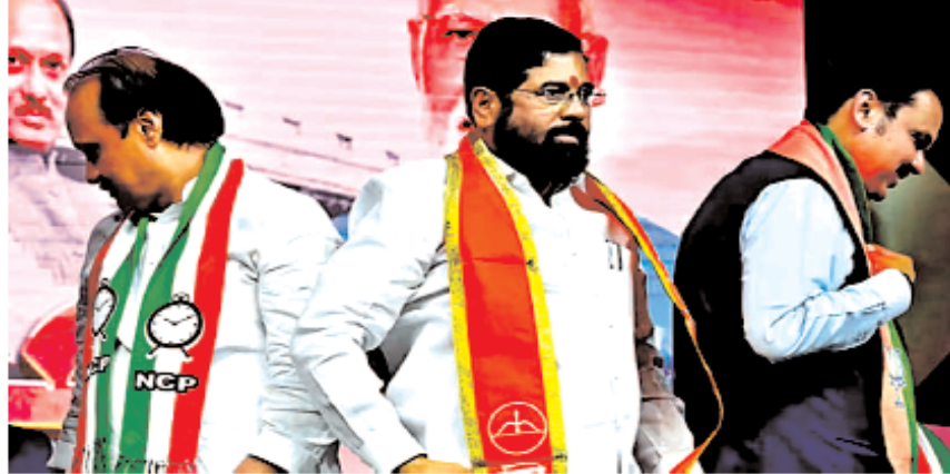
हे. उजर, शिवसेना (शिंदे) ने दावा किया है कि तीनों दल का सीटों पर चुनाव लड़ने हे कि सीट-बंटवारे का पर्याप्त जम नहीं हुआ है। मानना कम से कम का उलझे

महाराष्ट्र में ऐसी कई सीटें हैं, जिस पर बीजेपी-शिवसेना और एनसीपी गठबंधन में तीनों दलों की नजरें टिकी हुई हैं। ऐसे में गठबंधन के भीतर सीट बंटवारे को लेकर भारी तकरार मची हुई है।