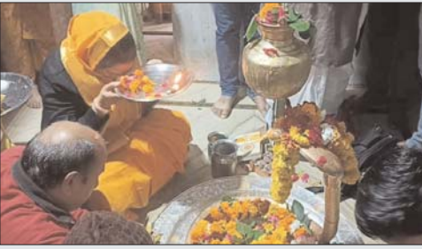
दैनिक पुष्पांजली टुडे

भिण्ड। भारतीय जनता पार्टी प्रदेश उपाध्यक्ष एवं भिंड दतिया सांसद श्रीमती संघ्या राय ने अपने जन्म दिवस पर शहर के प्रमुख धार्मिक स्थल गौरी सरोवर के किनारे स्थापित वानखंडेश्वर मंदिर पर पहुंचकर उन्होंने अभिषेक करते हुए भगवान शंकर भोलेनाथ की पूजा अर्चना कर शांति के सद्भावना सुख और शांति समृद्धि की भोलेनाथ से कामना की। उनसे आशीर्वाद ग्रहण किया।