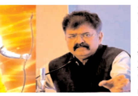
करीब करीब 10 दिनों के कार्यक्रमों में शामिल हो गईं।

नाथाना अंत ही में सीमा शुरू शिवसेना पुनराइ ने 'पितामही' के रूप में लोको को उम लता के दर्शन सुनिश्चित करने का वादा किया था।