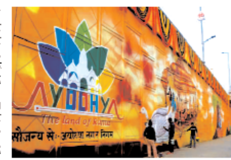
राम मंदिर प्राण प्रतिष्ठा कार्यक्रम का शुभारंभ रामपुर मेले में हुआ है।

नई दिल्ली। भारतीय जनता पार्टी (भाजपा) ने श्रद्धेय में राम मंदिर प्राण प्रतिष्ठा कार्यक्रम को शुरु और ऐतिहासिक बनाने की तैयारी शुरू कर दी है।