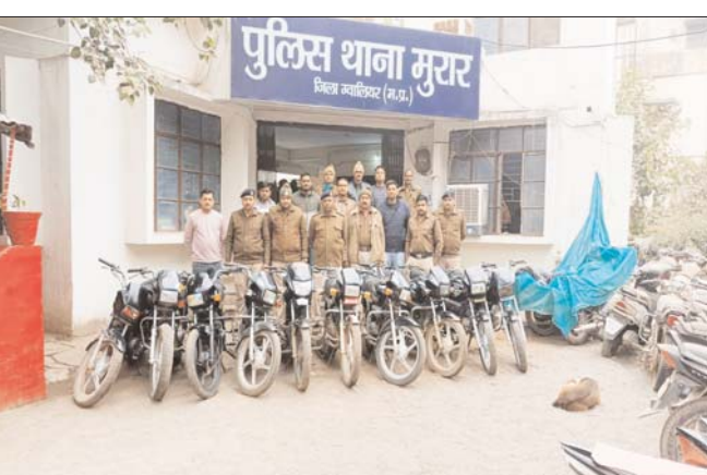
वाहन चोरों से गहनता से पूछताछ करने पर उनके द्वारा थाना मुरार क्षेत्र से 04 स्प्लेण्डर मोटर साइकिल तथा थाना इन्दरगंज क्षेत्र से 06 स्प्लेण्डर मोटर साइकिल चोरी करना स्वीकार किया। पुलिस टीम द्वारा पकड़े गये चोरों की निशादेही पर चोरी की 10 स्प्लेण्डर