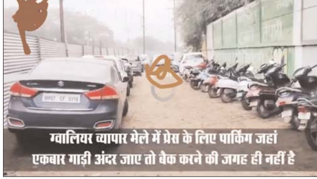
ज्वालियर- व्यापार मेले में लगातार कमियां देखने बताया कि पत्रकारों की पार्किंग के मामले में हमने

अधिकारी करें तो मेला सचिव के घेरे में है आखिर इनको पार्किंग से कितना पैसा मिल रहा है कार पार्किंग 750 एक बहुत बड़ा अमाउंट है देखते हैं इस पर क्या कहते हैं मेला प्रबंधन आगे की गतिविधियों के लिए