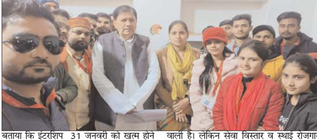
बताया कि इंटरशिप 31 जनवरी को खत्म होने वाली है। लेकिन सेवा विस्तार व स्थाई रोजगार

जनसेवा मित्र व्यक्ति को लाभ दिलाने के साथ अस्पताल, सरकारी दफतरो में जाकर उसे लाभ दिलाने का काम भी करते हैं। हमारे इन सभी कार्यों से प्रभावित हो तत्कालीन मुख्यमंत्री शिवराज सिंह जी ने घोषणा की थी कि आप इसी तरह प्रदेश के विकास के लिए काम कर जनता का जीवन बनाने का काम किजिए, आपका भविष्य बनाने का काम हम करेंगे, तत्कालीन मुख्यमंत्री जी ने विवेकानंद केंद्र की स्थापना कर व उसका संचालन जनसेवा मित्रों के माध्यम से कर रोजगार देने की भी बात की थी। वहीं जनसेवा मित्रों ने ज्ञापन में