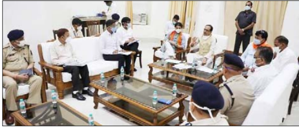
करने के निर्देश भी दिए। मुख्यमंत्री शिवराज सिंह चौहान ने जोर देकर कहा कि शासकोगे उचित मूल्य की दुकानों से सभी पात्र उपभोक्ताओं को समय से और पूरा ख़ाद्या मिले। उन्होंने निर्देश दिए कि राशन की कालाबाजारी को सखी से रोके। कालाबाजारी

ग्वालियर। जले हुए एवं खराब ट्रंसफार्मर युद्ध स्तर पर बदले जाएं। साथ ही इस बात का ध्यान रखें कि ट्रंसफार्मर पूरी क्षमता के हों, जिससे दुबारा ट्रंसफार्मर फुलने को मौक़ा न आए। इसमें किसी भी प्रकार की ढिलाई बर्दाश्त नहीं होगी। यह निर्देश मुख्यमंत्री शिवराज सिंह चौहान ने विद्युत वितरण कर्षण के अधिकारियों को दिए। साथ ही कहा कि बिजली को अनुसंधानक कक्षों में बंद न हो। उन्होंने रायसभा सांसद श्री ज्योतिरादित्य सिधिया के साथ ग्वालियर एवं चंबल संघा के विद्युत अधिकारियों को बैठक लेकर विद्युत व्यवस्था, खराब वितरण एवं अन्य जनहितोपयोगी योजनाओं की समीक्षा की। बैठक में ऊर्जा मंत्री श्री प्रद्युम्न सिंह तोमर भी मौजूद थे। रविवार को देर शाम नई वीआईपी सड़क हाउस नगर में आयोजित हुई बैठक में मुख्यमंत्री श्री चौहान ने जोर देकर कहा कि बिजली के अनाप-शापा अग्रत गैर वाजिब बिल कटवाए न जाएं। विद्युत ट्रंसफार्मर बदलने की कार्रवाई पर निगरानी रखने के लिये 'ट्रंसफार्मर रिप्लेसमेंट टीम' गठित की जाएगी। उन्होंने ऊर्जा मंत्री प्रद्युम्न सिंह तोमर को ट्रंसफार्मर रिप्लेसमेंट टीम गठित करने को जिम्मेवारी सौंपी है। इस टीम में विभागकर्मण सहित अन्य जनप्रतिनिधिगण शामिल किए जायेंगे। खराब विद्युत ट्रंसफार्मर की सूची तैयार कर प्रस्तुत