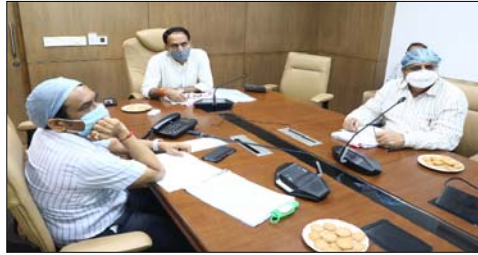
उनके आधार पर मध्यप्रदेश के रोजगार सेतु पोर्टल को अद्यतन किया जाये, साथ ही भारत सरकार के उज्ज्वल पोर्टल के साथ एकीकरण किया जाये, जिससे राज्य के प्रवासी