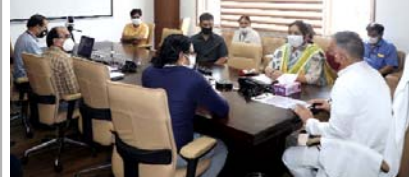
भोपाल। कूल शिक्षा राज्यमंत्री (स्वतंत्र प्रभार) श्री इन्दर सिंह परमार ने 'प्रज्वला' के तहत बालिका छात्रावासों एवं कस्तूरबा गांधी बालिका विद्यालय के स्टाफ को छात्रावास प्रबंधन एवं अकादमिक विन्दुओं पर ऑनलाइन प्रशिक्षण का शुभारंभ किया। प्रदेश के 52 जिलों के 223 गांवस हीस्टरी एवं 48 जिलों के 207 कस्तूरबा गांधी बालिका विद्यालय के शिक्षकों एवं अन्य रिजम अग्रण प्राप्ति ने कहा कि छात्रावासों स्टाफ को ऑनलाइन प्रशिक्षण दिया जायेगा। मंत्री श्री परमार ने कहा कि छात्रावासों को रहने-खाते की सुविधा के स्थान पर 'सेक्टर फॉर एक्सीलेंस' के रूप में विकसित किया जाये। जिससे छात्राओं का कर्तव्यविकास हो। छात्राओं को इकोसिस्टीम की चुनौतियों का सामना करने के लायक बनाने में यह अत्यंत आवश्यक है। मंत्री श्री परमार ने कहा कि कोरोना संकटकाल सभी के लिये चुनौती के साथ ही एक अवसर भी है। यह विपरीत परिस्थितियों में बेहतर तरीके से कार्य करने के लिये अमले को तैयार कर रहा है। इस विकटकाल में विद्यार्थियों तक गुणवत्तायुक्त शिक्षा उपलब्ध के लिये शिक्षा विभाग ने कई नवाचार किये हैं। प्रज्वला के तहत ऑनलाइन प्रशिक्षण से छात्रावासों में रहने वाली दूरस्थ गाँव की छात्राओं के समग्र विकास में सहायता