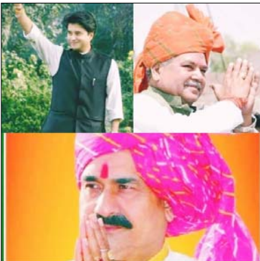
एक वरिष्ठ केंद्रीय मंत्री जिससे पूरा चंबल संभाषण चलता है वहीं आज उनके चरित्रानों की संभाषण के संगठन की भूमिका से दूर

आज जहां हर तरफ मध्य प्रदेश राजनीति की परकांडा मिलती जा रही है वहीं 22 अगस्त के सिंधिया टोरे ने कई ऐसे रोचक पहलुओं को जन्म दे दिया है जो अपने नवीन उत्पत्ति सिंधिया के प्रथम नगर आगमन राजसभा में जाने के बाद सिंधिया ही चर्चा का विषय बन गया है कहे जाते हैं कि वो कई कोसों की बीजेपी में शामिल हुए लेकिन कहीं ना कहीं यह एक फजी सदस्यता अधिपान से ज्यादा कुछ नहीं था आज हमारे अंक चंबल के इकलौता शेर पार्ट 3 में कुछ ऐसे रोचक पहलुओं का वर्णन करेगे जो यह बतलाएगा कि किस तरह चंबल की राजनीति दिन-ब-दिन बदलती जा रही है चंबल का बख्शर शेर केंद्रीय मंत्री ने जहां मुख्यमंत्री रूपी शाली को पीछे कर दिया था ऐसा कह सकते हैं की थानी परसने के बाद परसो नहीं गई कहीं ना कहीं इस बात को जन्म देती है कि चंबल में कुछ और शेर आ गए हैं जो अपने होने का एहसास करा रहे हमारे सूत्रों के द्वारा प्राप्त जानकारी से एक और संप्रमुख का भोगाव दौरा कई प्रश्नों को जन्म दे दिया संप्रमुख ने किसी भी बागी विधायकों से मिलने की इच्छा जाहिर नहीं की जा रही है कचरे के पुराने शेरों पर भी कहीं ना कहीं लगाने लगने की तैयारी की जा रही है