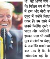
अमेरिकी राष्ट्रपति बने ओबामा जब 2010 में भारत आए तो उन्होंने भी अपने संस्कार से प्रभावित करके हिंदी में '५० बहन-बहन धन्यवाद' बोलकर भारत और भारतीयों के प्रति आभार जताया था। जबकि भारत का अंतिम प्रधानमंत्री जे.ए.के. जवाहर ला। विदेशी धरती पर रिस्क हिंदी नहीं उसकी शक्ति भाषाओं की जा जलजल कायस रहा है। आफको यह होना प्रधानमंत्री नरेंद्र मोदी जब अपने अमेरिकी यात्रा पर गए थे तो तत्कालीन राष्ट्रपति बराक ओबामा ने गुजराती भाषा में '५०केस मोरे प्रेमते मोदी' से स्वागत किया था।

डोनाल्ड ट्रम्प ने हिंदुस्तान और हिंदी की अहमियत समझे हुए अपनी पहली यात्रा को हिंदीमय बना दिया। इससे यह साबित होता है कि हिंदी अब बेचारी नहीं बल्कि ग्लोबल भाषक बनी हो गई है। अंग्रेजी के अतिरिक्त यह कई कनेक्टेड है कि ट्रम्प ने यह सवा अमेरिका में होने वाले एक चुनाव के लिए किया। क्योंकि अमेरिका में भारतीय मूल के 40 लाख लोग रहते हैं। लेकिन अलेक्जेंडर को यह सोचना होगा कि दुनिया के सबसे ताकतवर देश के राष्ट्रपति को हिंदी में टुट्टु की क्या जरूरत थी। यह अपनी बात अंग्रेजी में भी कह सकते हैं। हिंदी राष्ट्र से हिंदी का ग्लोबल मान बढ़ने में ट्रम्प और मोदी का अहम योगदान है। पहले टुट्टु में उन्होंने लिखा हम भारत आने के लिए धारा है। हम रातों में हैं, कुछ ही घंटों में हम सबसे मिलेंगे। दूसरे और तीसरे टुट्टु में उन्होंने भारत और अमेरिका के संबंधों का जिक्र किया। इसका अर्थ भी अमेरिका में रहने वाले भारतीय मूल के लोगों पर बहल होगा होगा। लोग इस टुट्टु के राजनीति मंच पर चढ़े जो निकलेंगे, लेकिन एक बात स्पष्ट है कि वैश्व स्तर पर हिंदी की स्वीकार्यता बढ़ी है। हिंदी में संबोधन किसी विदेशी राष्ट्रपति की कोई बड़ी बात नहीं है। पूर्व अमेरिकी राष्ट्रपति बने ओबामा जब 2010 में भारत आए तो उन्होंने भी अपने संस्कार से प्रभावित करके हिंदी में '५० बहन-बहन धन्यवाद' बोलकर भारत और भारतीयों के प्रति आभार जताया था। जबकि भारत का अंतिम प्रधानमंत्री जे.ए.के. जवाहर ला। विदेशी धरती पर रिस्क हिंदी नहीं उसकी शक्ति भाषाओं की जा जलजल कायस रहा है। आफको यह होना प्रधानमंत्री नरेंद्र मोदी जब अपने अमेरिकी यात्रा पर गए थे तो तत्कालीन राष्ट्रपति बराक ओबामा ने गुजराती भाषा में '५०केस मोरे प्रेमते मोदी' से स्वागत किया था।