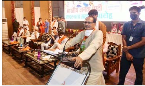
नहीं बनाई है। हमने सरकार प्रदेश के विकास और जनता के कल्याण के लिए बनाई है। प्रदेश

ग्वालियर। ग्वालियर में सदस्यता अभियान के तीसरे दिन मुख्यमंत्री शिवराज सिंह चौहान ने कहा कि कांग्रेस में सत्य कहने वालों को गद्दार कहा जाता है। महाराज ने सत्य बोला तो उन्हें गद्दार बना दिया। जबकि ज्योतिरादित्य सिंधिया सबसे बड़े खुदगर्भ हैं। मुख्यमंत्री ने राहुल गांधी पर भी अमक-हमला बोला। शिवराज ने कहा- कांग्रेस नेताओं ने पत्र लिखा कि पूर्णकालिक अध्यक्ष चाहिए, तो राहुल गांधी कहने लगे कि वे गद्दारी हैं। सत्य कहने वालों को कांग्रेस में गद्दार कहा जाता है। ऐसी पथभ्रष्ट कांग्रेस को कोई बचा नहीं सकता है। सीएम शिवराज सिंह चौहान ने कहा- प्रदेश के गरीबों के कल्याण और प्रदेश के विकास की वित्तीय योजनाएं थीं, कांग्रेस ने बंद कर दी थी। गरीबों, किसानों, युवाओं को उगने वाली कांग्रेस सरकार को प्रदेश की जनता जवाब देगी। कमनायथ जी से जब भी प्रदेश विकास और जनकल्याण के कार्यों के लिए बात की जाती थी, तो ऐसे का रोना नहीं रोऊंगा। सीएम ने कहा- सत्ता के स्वर्ण सिंहासन के लिए हमने सरकार