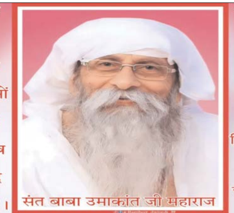
तार से इस समय पर गुरु होते हैं। लेकिन उनको भी लोग न समझ करके भ्रम और भूल में डाल देते हैं। भ्रम हो जाता है कि गुरु सच्चे हैं या

ऐसी जब कोई चीज बताया जाता है की गुरु महाराज बड़ा मिशन हमारे-आपके लिए छोड़कर के गए, गुरु महाराज को आपसे उम्मीद रहा, आपको पढ़ाया-लिखाया, गुरु महाराज की दया से ही पढ़े-लिखे, गुरु महाराज की दया से ही धन-दौलत आपको मिला, गुरु महाराज के पास आने-जाने लगे तो घर बन गया, आपका स्तर वैसा नहीं था लेकिन वो स्तर भी हो गया। और आप गुरु के लिए क्या कर रहे होड़ गुरु के लिए कितना समय निकाल रहे होड़ तब कहते हो बताइए, अब क्या करना है। तब कहा जाता है, प्रचार करो, लोगों को जगाओ, शाकाहारी नशा मुक्त बनाओ, अपराधी प्रवृत्तियों से हटाओ, देश भक्ति, मानव भक्ति सिखाओ, देवी-देवता भगवान के प्रति आस्था पैदा करो, किसी की निंदा बुराई में लोग न फंसे, यह बात लोगों को बताओ। तो आपके अंदर जोश आता है,