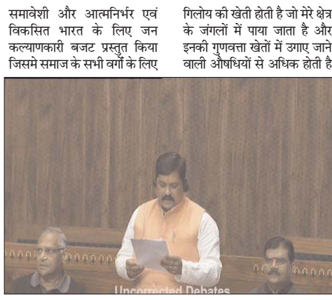
समावेशी और आत्मनिर्भर एवं विकसित भारत के लिए जन कल्याणकारी बजट प्रस्तुत किया जिसमें समाज के सभी वर्गों के लिए