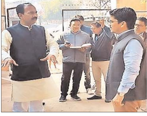
निगमायुक्त ने जल्द समाधान का आश्वासन दिया। क्षेत्रीय कार्यालय 20 का निरीक्षण करते हुए कंप्यूटर में चढ़ाने के निर्देश दिए। लकड़खाना स्थित संजीवनी क्लीनिक की दीवारों में सीलन