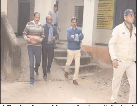
निर्देशित किया कि यह सुनिश्चित किया जावे कि परीक्षा संबंधी सभी व्यवस्था ठीक होना चाहिये। उन्होंने परीक्षा केन्द्राध्यक्षों से परीक्षा से संबंधित विभिन्न व्यवस्थाओं की जानकारी ली। उन्होंने परीक्षा केन्द्रों