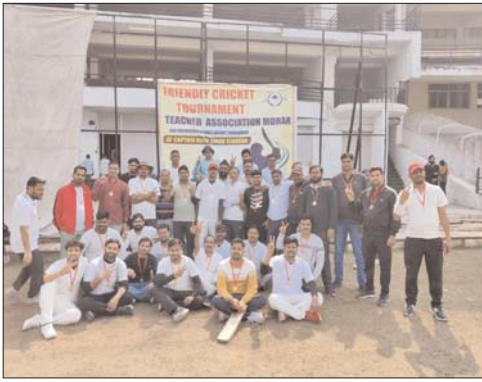
स्टार्स की टीम 12 ओवर में और 15 रन से हार गईं। जिसमें