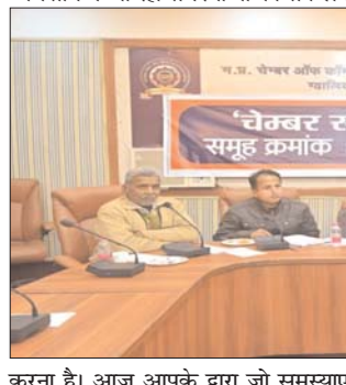
करना है। आज आपके द्वारा जो समस्याएं

कि 'चेम्बर संवाद' का उद्देश्य आपके व्यवसाय में आ रही समस्याओं का संकलन