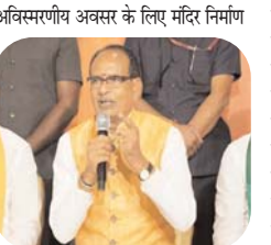
दूर की ओर से अयोध्या आकर कार्यक्रम में शामिल होने के लिए आमंत्रण मिला है. इसी बीच मध्य प्रदेश के पूर्व मुख्यमंत्री

मध्य प्रदेश के पूर्व मुख्यमंत्री शिवराज सिंह चौहान 22 जनवरी को भगवान रामलला की प्राण प्रतिष्ठा कार्यक्रम में शामिल होने अयोध्या नहीं जाएंगे. उन्होंने कहा है कि "22 जनवरी को ओरछ के राम राजा सरकार के मंदिर जाकर रामधुन गाएंगे." इसी तरह पूर्व मुख्यमंत्री कमलनाथ ने भी कहा है कि "राम मंदिर का पट्टा बीजेपी के पास नहीं है. यहां बताते चलें कि 22 जनवरी को अयोध्या में भगवान श्रीराम के नवनिर्मित मंदिर और रामलला की मूर्ति की प्राण प्रतिष्ठा प्रधानमंत्री नरेंद्र मोदी द्वारा किया जाएगा. इस वक्त देश भर में चर्चा है कि किस-किस को इस