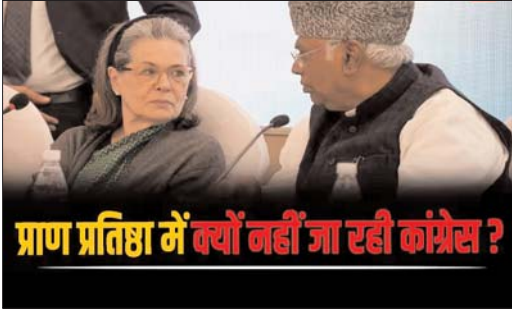
प्राण प्रतिष्ठा में क्यों नहीं जा रही कांग्रेस?

तो सार यही निकलता है. जयराम रमेश ने लिखा, "हमारे देश में लाखों लोग भगवान राम की पूजा करते हैं. धर्म एक निजी मामला है, लेकिन आरएसएस