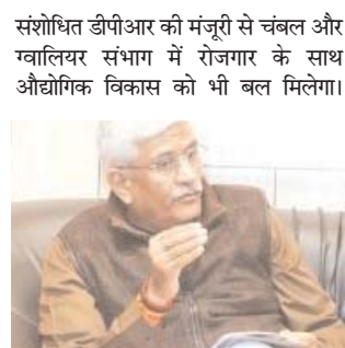
सिंचाई के लिये दबावयुक्त परियोजना लाने से अतिरिक्त रूप से हजारों हेक्टेयर भूमि पानी भी उपलब्ध होगा। केन्द्रीय मंत्री ने इस कार्ययोजना पर विस्तार करने का आश्वासन

लिये आवश्यक सहयोग प्रदान करने हेतु आश्वासन दिया। जल संसाधन मंत्री सिलावट ने केन्द्रीय मंत्री को अन्य परियोजना का संशोधित एमओयू भी प्रस्तुत किया। केन बेतवा परियोजना से संबंधित क्षेत्र की अन्य नदियों के संबंध में परियोजना की कार्य योजना भी प्रस्तुत की। जल संसाधन मंत्री तुलसीराम सिलावट ने बताया कि केन-बेतवा परियोजना के द्वितीय चरण और उससे संबंधित परियोजना के लिये संशोधित कार्ययोजना बनाई जाकर प्रस्तुत की गई है। इससे ग्वालियर-चंबल क्षेत्र में सिंचाई के लिये अतिरिक्त पानी उपलब्ध होगा और उद्योग धंधे लगने से रोजगार के हजारों अवसर के साथ जांब भी उपलब्ध होगा। उन्होंने केन्द्रीय मंत्री शेखावत को बताया कि