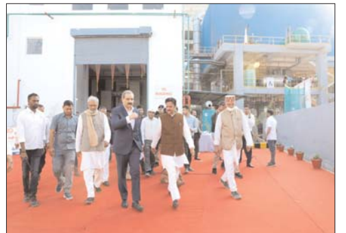
बोर्ड के अधिकारी इन निर्माण कार्यों को शुरू कराने की कार्यवाही तत्काल शुरू करें। उप मुख्यमंत्री ने कहा कि नवीन सर्किट हाउस भवन का निर्माण समय सीमा में पूरा कराए। इसकी आंतरिक सज्जा-सज्जा, फर्नीचर आदि की भी व्यवस्था सुनिश्चित करें। सर्किट हाउस में भी अतिरिक्त निर्माण कार्य स्वीकृत किए गए हैं। अब निर्माण कार्यों की कुल लागत 6 करोड़ 25 लाख रुपए हो गई है। नवीन कार्यों को शुरू कराने की प्रक्रिया आरंभ करें। निरीक्षण के समय नगर निगम अध्यक्ष श्री व्यंकटेश पाण्डेय, श्री राजेश पाण्डेय, कलेक्टर श्रीमती प्रतिभा पाल, आयुक्त नगर निगम श्रीमती संस्कृति जैन, अधीक्षण यंत्री शैलेन्द्र शुक्ला, कार्यपालन यंत्री हाउसिंग बोर्ड अनुज प्रताप सिंह तथा निर्माण एजेंसी के प्रतिनिधि उपस्थित रहे।

उप मुख्यमंत्री श्री राजेन्द्र शुक्ल ने निर्माणधीन सिविल लाइन पार्क का अवलोकन किया। मौके पर उपस्थित अधिकारियों तथा निर्माण एजेंसी के प्रतिनिधियों को निर्देश देते हुए उप मुख्यमंत्री ने कहा कि सिविल लाइन पार्क का शेष निर्माण कार्य शीघ्र पूरा कराए। पार्क के चारों ओर बनाई जा रही सड़क का कार्य लगभग पूरा हो रहा है। इसमें दोनों ओर पेपर लगाने का कार्य तत्काल शुरू कराए। अच्छी गुणवत्ता के आकर्षक पेपर ब्लॉक लगाए। सिविल लाइन पार्क को विकसित करने के लिए 2.13 करोड़ रुपए के अतिरिक्त कार्य मंजूर किए गए हैं। इस राशि से 19 दुकानें, पार्किंग एरिया तथा चिल्ड्रेन एरिया का विकास किया जाएगा। साथ ही पार्क में ओपेन जिम की भी व्यवस्था की जाएगी। पार्क के समीप महिलाओं के लिए तीन तथा पुरुषों के लिए तीन शौचालयों का निर्माण कराया जाएगा। हाउसिंग