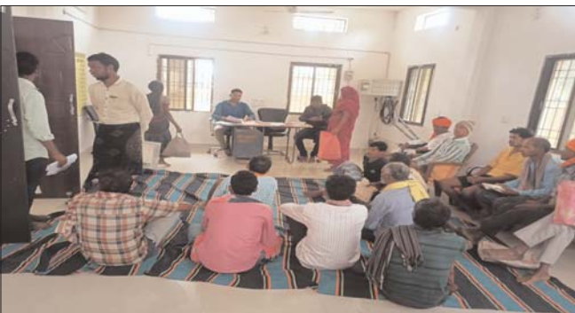
एवं लैण्ड सिडिंग नहीं कराने के कारण से विकासखण्ड स्तरीय वरिष्ठ कृषि विकास

पंजीयन नहीं कराया है तथा योजना में योजना के लाभ से वंचित अपने क्षेत्र के पंजीकृत ऐसे किसान जिनका आधार सीडिंग ग्रामीण कृषि विस्तार अधिकारी एवं