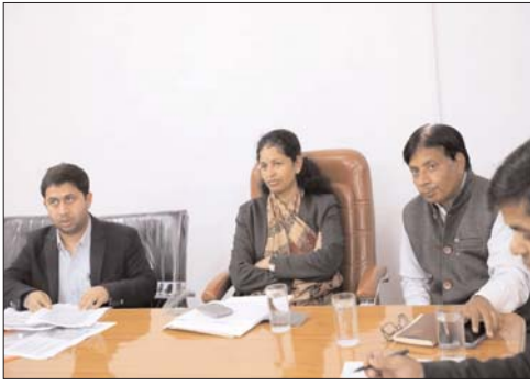
के साथ-साथ सीमांकन, बंटवारा की। कलेक्टर ने न्यायालय में हल्केवार प्रकरणों के संबंध में

से करें। तहसील में काफी संख्या में नक्शा तर्मीम के लंबित प्रकरणों पर उन्होंने नाराजगी व्यक्त