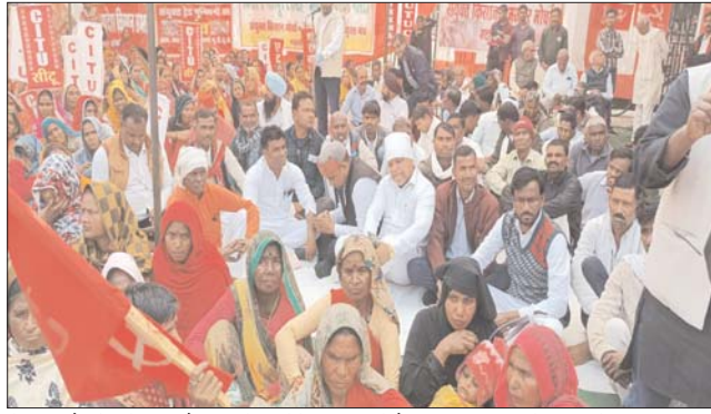
खोद रखी है, ड्रोन से आंसू गैस की गोली छोड़ें जा रहे हैं, इसकी तीखी आलोचना करते हुए यह प्रस्ताव

किसान भी आज अपना दूध लेकर नहीं आए, हड़ताल के लिए एक हड़ताली कैप फूल बाग चौराहे पर बनाया गया था सुबह 11:00 बजे से ही किसानों और मजदूरों के जत्थे फूल बाग पर बनाये कैप में पहुंचना शुरू हो गए थे 12:00 बजे तक हजारों की संख्या में मजदूर किसान एकत्रित हुए, वहां हुई सभा को संबोधित करते हुए नेताओं ने कहा कि जब तक एएसपी की गारंटी सुनिश्चित नहीं होती जब तक 26000 रुपये न्यूनतम वेतन की घोषित नहीं किया जाता, सर्विदा, टेक, आउटसोर्सिंग प्रथा को समाप्त नहीं किया जाता किसानों की सख्खि नहीं बढ़ाई जाती, डीजल, खाद, बीज सहित उर्वरकों के दाम नहीं घटाए जाते तब तक आंदोलन जारी रहेगा बल्कि और तीव्र होगा फूलबाग से दिल्ली के बांडर पर पंजाब से आए हुए किसानों को रोकने के लिए केंद्र सरकार ने जिस तरीके से कटौत तार, कोले, लगा रखी है खंडक