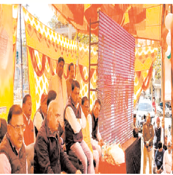
वाले लोगों को बहुत लाभ प्राप्त होगा। हमारे देश-प्रदेश के युवा, जो डॉक्टर बनने का सपना देखते हैं, उन्हें भी इस सपने को साकार करने में आसानी होगी।

बल्लभगढ़. प्रदेश के परिवहन एवं उच्चतर शिक्षा मंत्री मूलचंद शर्मा ने कहा कि प्रधानमंत्री नरेंद्र मोदी के नेतृत्व वाली केंद्र सरकार द्वारा शुरू की गयी विकसित भारत संकल्प यात्रा ने लोगों को बिना सरकारी दफतरो के चकर लगवाए केंद्र व प्रदेश की विभिन्न योजनाओं का लाभ दिलाकर एक नया आयाम स्थापित किया है। केंद्र की मोदी व प्रदेश की मनोहर सरकार पीक में खड़े अंतिम व्यक्ति के उत्थान के लिए प्रतिबद्धता से कार्य कर रही है। परिवहन मंत्री शुक्रवार को विकसित भारत-विकसित हरियाणा के तहत जिला रेवाड़ी में आयोजित विभिन्न परियोजनाओं के उद्घाटन व शिलान्यास समारोह के बल्लभगढ़ स्थित जनता कॉलोनी में आयोजित जिला स्तरीय लाइव प्रसारण कार्यक्रम में बतौर मुख्य अतिथि शिरकत कर लोगों को संबोधित कर रहे थे। परिवहन मंत्री ने कहा कि आज रेवाड़ी में प्रधानमंत्री नरेंद्र मोदी द्वारा देश के 22वें एमएस का शिलान्यास किया जा रहा है। इसके उद्घाटन के पश्चात आमजन, खासकर दक्षिण हरियाणा व राजस्थान के सीमा क्षेत्र में रहने