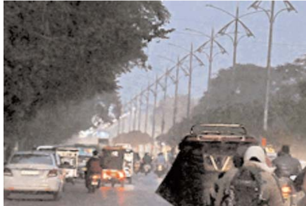
ही लाइटों को सुधरने के लिए लगाई गई थीं। ये टर्मिनेशन का नोटिस मिला तो कराई परेड फिर भी नहीं सुधरीं व्यवस्थाएं

ग्वालियर(नप्र)। स्मार्ट सिटी कार्पोरेशन तथा नगर निगम के लिए जी का जंजाल बन चुकी स्ट्रीट लाइट व्यवस्था सुधरने का नाम नहीं ले रही है। कंपनी द्वारा कई माह बीतने के बाद भी लाइटों में सुधार के लिए जब पर्याप्त अमला नहीं लगाया, तो अधिकारियों ने ठेके के टर्मिनेशन का लैटर जारी कर दिया। ये पत्र मिलते ही आनन-फानन में कर्मचारियों की परेड तो करा दी गई, लेकिन अब भी शहर के प्रमुख मार्ग अंधेरे में डूबे हुए हैं। चेतकपुरी से लेकर थोम रोड तक अंधेरे में नजर आ रही है। इसके चलते अब नगर निगम आयुक्त हर्ष सिंह ने आगामी मंगलवार को समीक्षा बैठक बुलाई है। इस दौरान सीएम हेल्पलाइन से लेकर पार्श्वों तक के फीडबैक पर बात की जाएगी। यदि व्यवस्था नहीं सुधरती, तो पूर्व में दिए गए नोटिस को अमल में लाया जाएगा। स्मार्ट सिटी कार्पोरेशन ने नोएडा की एचपीएल इलेक्ट्रिकल्स प्राइवेट लिमिटेड कंपनी को शहर में स्ट्रीट लाइटों के संचालन एवं संधारण की जिम्मेदारी सौंपी है। कंपनी द्वारा टेंडर की शर्तों का पालन न करते हुए सिर्फ 25 से 30 टर्मिनेशन