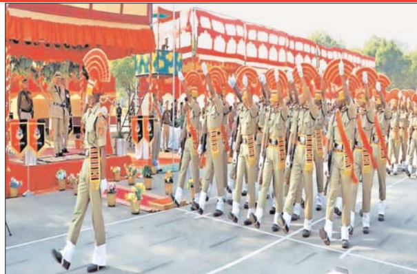
क्षेत्रों में सर्वोत्तम कैडेट चुने गए, जिनको मुख्य अतिथि ने ट्रॉफी व मेडल देकर सम्मानित किया। इनडोर और आउटडोर का दिया गया प्रशिक्षण-समारोह के पूर्व 75 प्रशिक्षणार्थियों को योग्य अनुदेशकों द्वारा 44 सप्ताह का बुनियादी प्रशिक्षण दिया गया, जिसमें आउटडोर विषय हथियारों का प्रशिक्षण, खेलकूद तथा इनडोर प्रशिक्षण के विषय जैसे भारतीय संविधान, शासकीय सेवा से संबंधित विभिन्न नियम, मानवाधिकार, सूचना का अधिकार, समाज कल्याण, कानून व्यवस्था, व्यक्ति विकास व मानव व्यवहार व कंप्यूटर में प्रशिक्षित किया गया।