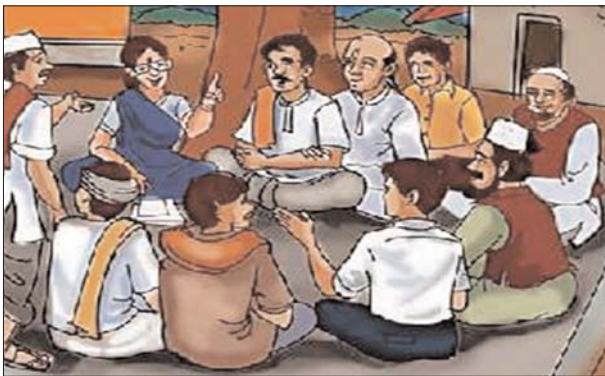
कर परिवार को जुड़े रखने का है न किसी पक्ष को सजा देने का है। सिंधी समाज में यह व्यवस्था 42 वर्ष से है। हर माह आठ से दस विवादों का निपटारा सामाजिक स्तर पर किया जाता है। घर की चारदीवारी के बाहर सुनाई तक नहीं देती है। यह अलग बात है कि अब पश्चिमी देश संयुक्त परिवार के महत्व को समझ रहे हैं। हमारे यहां भी अभी संयुक्त परिवारों को बचाने के लिए