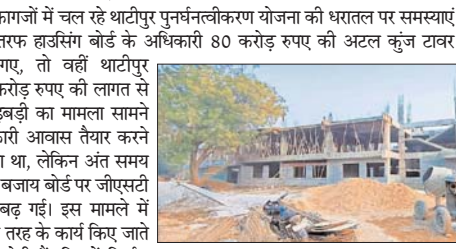
ग्वालियर। दो दशक से भी लंबे समय से कागजों में चल रहे थाटीपुर पुनर्नवीकरण योजना की धरातल पर समस्याएं खत्म होने का नाम नहीं ले रही है। एक तरफ हार्डवेयर बोर्ड के अधिकारी 80 करोड़ रुपए की अटल कुंज टावर परियोजना में जीएसटी लगाना भूल गए, तो वहीं थाटीपुर पुनर्नवीकरण योजना के अंतर्गत 160 करोड़ रुपए की लागत से तैयार हो रहे आवासों में जीएसटी की गड़बड़ी का मामला सामने आया है। इस परियोजना के अंतर्गत सरकारी आवास तैयार करने पर ठेकेदार को जीएसटी का भुगतान करना था, लेकिन अंत समय में टेंडर की शर्तों में बदलाव कर ठेकेदार के बजाय बोर्ड पर जीएसटी डाल दी गई। इसके प्रोजेक्ट की लागत बढ़ गई। इस मामले में ईओडब्ल्यू ने जांच शुरू की है। बोर्ड द्वारा दो तरह के कार्य किए जाते हैं। इसमें बोर्ड की स्वयं की परियोजनाएं होती हैं, जिनमें निर्माण कारगर बोर्ड द्वारा संघर्षियों की बिजली की जाती है। दूसरी परियोजनाएं शासकीय होती हैं, जिनमें बोर्ड को निर्माण एजेंसी बनाया जाता है। शासकीय परियोजनाओं के लिए किए जाने वाले टेंडर में बोर्ड द्वारा शर्त रखी जाती है कि जीएसटी की राशि का भुगतान ठेकेदार द्वारा ही किया जाएगा। ऐसे में इच्छुक कंपनियां इस आधार पर टेंडर में अपना आफर डालती हैं। थाटीपुर पुनर्नवीकरण परियोजना में वर्तमान में जो आवास तैयार हो रहे हैं, वो शासकीय परियोजना के अंतर्गत हैं। ऐसे में ठेकेदार कंपनियों को ही जीएसटी की राशि जमा करनी थी।