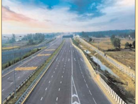
जारी किए गए थे 3 टेंडर-पूर्व में जारी किए गए टेंडर को एनएचएआइ ने आगरा से धौलपुर के बीच 36.800 किमी का पहला पैकेज 972.10 करोड़ रुपये का तय किया था। इसी प्रकार 36.800 से 51.200 किमी तक 14.40 किमी का दूसरा पैकेज 1012.38 करोड़ रुपये और 37.200 किमी लंबाई का तीसरा पैकेज 997.41 करोड़ रुपये का तय किया था। इसके लिए गत दिसंबर 2023 में तीन अलग-अलग टेंडर जारी किए गए थे।

ग्वालियर। ग्वालियर से आगरा तक प्रस्तावित 88.40 किमी लंबे सिक्स लेन एक्सप्रेस वे को तीन के बजाय अब एक ही पैकेज में तैयार किया जाएगा। पूर्व में नेशनल हाइवे अथॉरिटी ऑफ इंडिया ने इसकी अनुमानित लागत 2500 करोड़ रुपये के आसपास तय की थी। इसे हाइब्रिड एन्यूटी मोड पर तैयार करने के लिए तीन पैकेज निर्धारित किए थे, लेकिन कंपनियों के रुचि नहीं लेने के कारण अब इसे एक ही पैकेज में सीधे 88.40 किमी का ठेका देने के टेंडर किए हैं। इससे बिल्ट आउट एंड ट्रांसफर यानी बीओटी बेसिस पर तैयार किया जाएगा। ऐसे में प्रोजेक्ट की लागत में भी वृद्धि हो गई है। अब एनएचएआइ ने इसके लिए 3841 करोड़ रुपये की राशि का टेंडर जारी किया है, जो आगामी 23 फरवरी को खोला जाएगा।