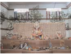
बरसा कर स्वागत किया गया विश्वकर्मा जयंती में गुना जिले सहित अशोक नगर, राजगढ़ जिले से भी

निचला बाजार स्थित भगवान विश्वकर्मा मंदिर से विश्वकर्मा समाज द्वारा एक भव्य चल समारोह नगर में निकाला गया चल समारोह का समापन राजीव गांधी चौराहा से होते हुए पुनः निचला बाजार स्थित विश्वकर्मा मंदिर पर किया गया। चल समारोह का नगर में जगह-जगह फूल