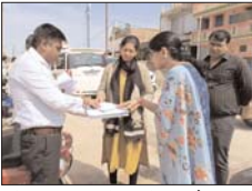
मोहन सभागा में आयोजित बैठक में कलेक्टर ने जनपद के सीईओ व नगरीय निकाय के सीएमओ निर्देश दिये कि संबंधित बीएमओ से समन्वय स्थापित