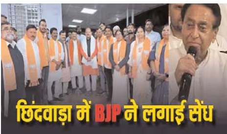
छिंदवाड़ा में BJP ने लगाई सैध

ये 7 पार्षद बीजेपी में हुए शामिल-भारतीय जनता पार्टी