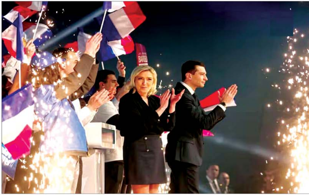
फ्रांस में फेंच फार राइट एक रैली में संसदीय नेता जोर्डन बारडेला और मैरियाना ली पेन भी शामिल हुए।