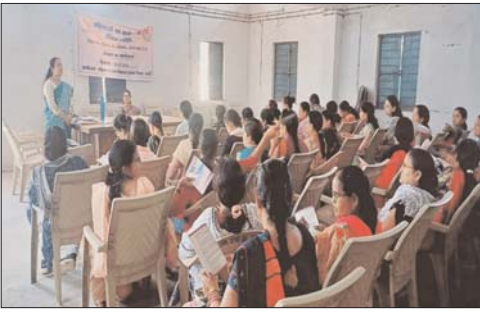
गया कि हिंसा केवल शारीरिक ही नहीं बल्कि

किया गया, उसके संबंध में विस्तृत सारगर्भित बातें बताई गईं। साथ ही बताया