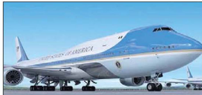
7 घंटे की दूरी 90 मिनटों में होगी तय

वाशिंगटन । अमेरिका के राष्ट्रपति अब अत्याधुनिक हाइपरसोनिक प्लेन में उड़ान भरेंगे। विमान हाइपरसोनिक इंजन से लैस हो गया तो न्यूयॉर्क से लंदन की दूरी मात्र 90 मिनट में तय कर सकेंगे। अभी इस यात्रा के लिए करीब 7 घंटे का समय लगता है। यहा हाइपरसोनिक विमान एक कंबाईंड टर्बोफैन डिजाइन पर आधारित है जो एक सामान्य टर्बोफैन इंजन और रैमजेट दोनों को एक इंजन में फ्यूज करता है। एक सामान्य टर्बोफैन इंजन सामने से हवा को खींचकर प्रेशर से पीछे धकेलता है। इस इंजन से मिली ताकत