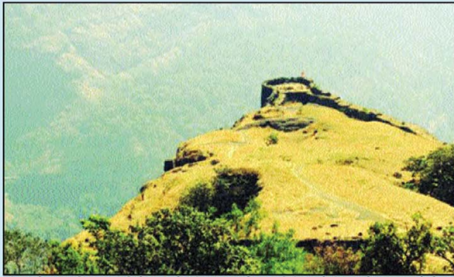
हिल स्टेशन की राजकुमारी के नाम से प्रसिद्ध तमिलनाडु का कोड्डुकनाल भारत के बेस्ट मॉनसून डेस्टिनेशन में से एक है। पश्चिमी घाट

मुंबई और पुणे जैसे शहरों के शोर और भीड़-भाड़ से दूर आप लोनावला आकर कुछ पल शांति और सुकून से बिता सकते हैं। मुंबई के बगल में होने की वजह से आपको यहां जाने के लिए ज्यादा पैसे खर्च करने की जरूरत नहीं होगी।