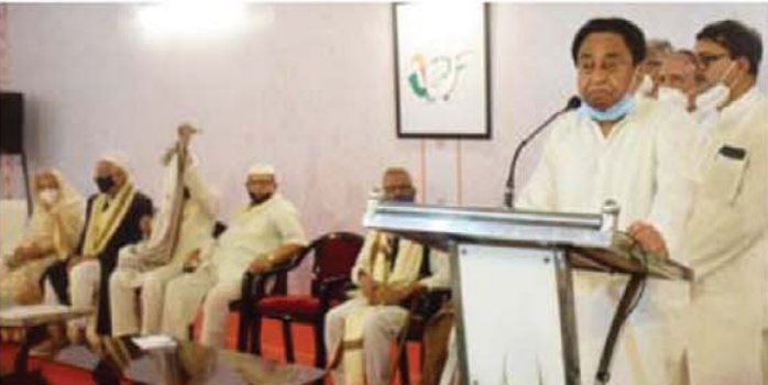
कांग्रेस ने गोरों से देश बचाया था अब सौदागरों से लोकमत बचावेगी