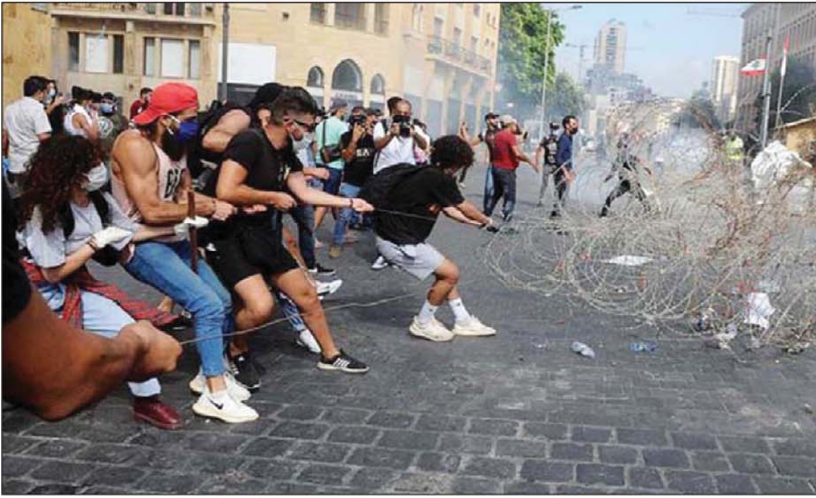
बेजिंग में प्रदर्शन कारियों के विरोध ने हिंसक रूप ले लिया। इस दौरान कई लोग घायल हो गये।