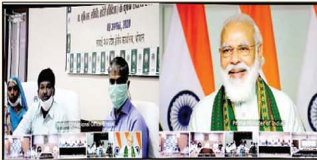
'कोष' इत्यादि के सुजन को उत्प्रेरित करेगा। केंद्रीय मंत्रिमंडल ने एक लाख करोड़ रुपये के 'कृषि अवसंरचना कोष' के तहत वित्तपोषण सुविधा के लिए

भोपाल। किसानों के लिए खेती फायदे का धंधा बनाने के लिए प्रधानमंत्री नरेंद्र मोदी ने 'कृषि अवसंरचना कोष' के तहत एक लाख करोड़ रुपये की वित्तपोषण सुविधा का उद्घाटन किया। यह कोष फसलों की 'कटाई' के बाद फसल प्रबंधन अवसंरचना और 'सामुदायिक कृषि परिसंपत्तियों' के सुजन को बढ़ा देने के लिए शुरू किया जा रहा है। मोदी ने किसानों को वीडियो कॉन्फ्रेंसिंग के माध्यम से संबोधित करते हुए कहा कि देश में आज समस्या कृषि उत्पादन को लेकर नहीं, बल्कि कटाई के बाद खेते वाले नुकसान को लेकर है। उन्होंने कहा कि इस कोष से इस समस्या को हल करने में मदद मिलेगी। यह कोष कोष 'कटाई' बाद फसल प्रबंधन अवसंरचना और 'सामुदायिक कृषि परिसंपत्तियों' जैसे कि शीत भंडार गृह, संग्रह केंद्रों, प्रसंस्करण इकाइयों आदि बनाने में मददगार होगा। केंद्रीय मंत्रिमंडल ने एक महीने पहले