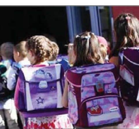
द्वारा जारी एक बयान में कहा गया है कि स्कूल कम से कम बुधवार तक बंद रहेगा। इसके अलावा

बर्लिन । जर्मनी में वैश्विक महामारी कोरोना का प्रकोप अभी पूरी तरह खत्म नहीं हुआ और ऐसे में वहाँ में गर्मी की छुट्टियों के बाद स्कूल खोल दिए गए जिसके कारण संक्रमण तेजी से फैलने लगा। मीडिया रिपोर्ट के अनुसार कोरोना वायरस की नई लहर के चलते गर्मियों की छुट्टियों के बाद खोले गए 2 स्कूलों के सैंकड़ों छात्रों को वापस भेज दिया गया और स्कूल बंद कर दिए गए। मेकलेनबर्ग-वेस्टर्न पोमेरमरिया राज्य में खुले स्कूलों में एक अध्यापक के कोरोना संक्रमित पाए जाने के बाद छात्रों को घर वापस भेज दिया गया। सोमवार को माध्यमिक स्कूल को फिर से खोलने के बाद संक्रमित शिक्षक के बारे में पता चलने के बाद अब सभी 55 शिक्षकों को अब वायरस का परीक्षण करना होगा। जिला प्रशासन