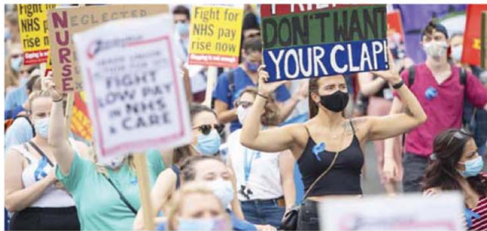
लंदन में नेशनल हेल्थ सर्विस के कर्मचारी वेतन को लेकर सड़कों पर उतर गये।

हैं कि पीएलए टापू पर कब्जे के लिए युद्धाभ्यास शुरू कर सकता है। इस बारे में ताइवान न्यूज ने मई में रिपोर्ट किया था कि पीएलए अगस्त में जो ड्रिल करेगा उसमें बड़ी संख्या में मरीन सैनिक, शिप, होवरक्राफ्ट और हेलिकॉप्टर शामिल होंगे। गौरतलब है कि दक्षिण चीन सागर में जिस क्षेत्र पर चीन की नजर है वह खनिज और ऊर्जा संपदाओं का भंडार है। चीन का दूसरे देशों से टकराव भी कभी तेल, कभी गैस तो कभी मछलियों से भरे क्षेत्रों के आसपास होता है। चीन एक यू शोप की नाइन डैश लाइन के आधार पर क्षेत्र में अपना दावा ठोकता है। इसके अंतर्गत वियतनाम का एक्सक्लूसिव इकनॉमिक जोन, परासल टापू, स्ट्रेटली टापू, क्रूने, मलेशिया, इंडोनेशिया, फिलिपीन और ताइवान के एक्सक्लूसिव इकनॉमिक जोन भी आते हैं।