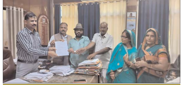
23 मार्च, डॉ. लोहिया के जन्म दिवस को विश्व संसद दिवस के रूप में मनाया जाए

मंदिर के पास का मैदान, लाला का बाजार में महारूद्र मण्डल के सामने व सेवानगर पार्क को चुनावी सभा के लिये चिन्हित किया गया है। जिले में लोकसभा आम चुनाव कराने के लिए एमएलबी कालेज से मतदान सामग्री का वितरण किया जाएगा। साथ ही मतदान के बाद एमएलबी कालेज में ही विधासभा क्षेत्रवार अलग-अलग स्ट्रांग रूम में कड़ी सुरक्षा के बीच