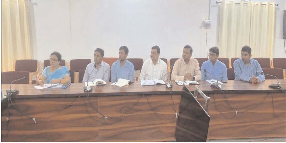
सामग्री जमा करने के बारे में विस्तार से बताया। पीठासीन ही प्राप्त करें, इसके साथ ही उन्होंने बारे में बताया। मास्टर ट्रेनर को यह निर्देशित

करना तथा सामग्री प्राप्ति काउंटर एवं वापसी ईवीएम एवं सील पेपर, निविदत्त मत हेतु मतपत्र सामग्री वापसी पर की जाने वाली कार्यवाही के