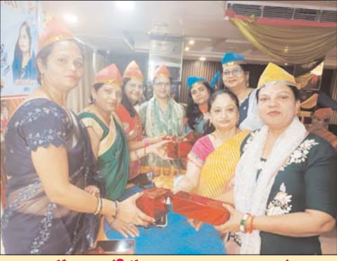
माहौर ज्वार वैश्य महाराजा महासेन महिला समिति का होली मिलन समारोह रंगारंग कार्यक्रम के साथ संपन्न हुआ दैनिक पुष्पांजली टुडे