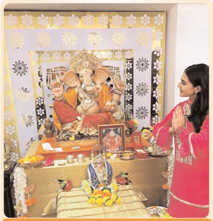
गणपति बप्पा के दरबार में दिखाईं