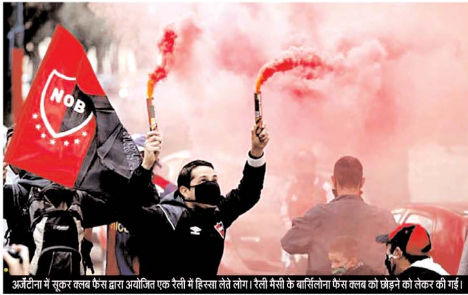
अर्जेंटीना में सूकर क्लब फैंस द्वारा आयोजित एक रैली में हिस्सा लेते लोग। रैली में सी के बार्सिलोना फैंस क्लब को छेड़ने को लेकर की गई।