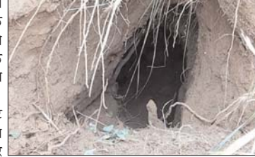
इसके अलावा रेत की बोरी पर टेलीफोन नंबर भी छपे हुए हैं। जैसा कि आमतौर पर सीमेंट की बोरियां पर छपा रहता है। जहां सुरंग मिली है वहां से पाकिस्तान की चौकी महज 400 मीटर की दूरी पर है। बता दें कि जम्मू कश्मीर में आतंकियों को भेजने के लिए सुरंग खोदने का