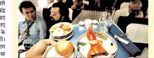
एयरलाइन कंपनियों के लिए नई गाइलाइन्स

नई दिल्ली ■ एजेसी कोरोना में हवाई यात्रा करने वाले पैसेंजर्स के लिए खुशखबरी है। केंद्र से नियमों में मिली ढील के बाद एयरलाइन कंपनियों पैसेंजर्स के लिए घरेलू और इंटरनेशनल उड़ानों के दौरान पैकड फूड उपलब्ध कराएंगी। एविएशन मंत्रालय ने गुरुवार शाम को आदेश जारी करते हुए कहा था कि एयरलाइन कंपनियों प्री पैकड स्नैक्स और खाने-पीने का सामान पराम्ब सुकनी है। दरअसल, इससे पहले घरेलू उड़ानों में खाने-पीने का सामान नहीं पराम्ब जाता था, जबकि इंटरनेशनल उड़ानों के दौरान सीटों पर भोजन के पैकेट रखे जाते थे। एयरलाइंस को होगा फायदा उड़ानों में भोजन पराम्ब की अनुमति मिलने के बाद उन एयरलाइन कंपनियों को फायदा मिलेगी जिनका किराया कम है। कंपनियों को इसके जरिए अच्छा मुनाफा हो सकता है, लेकिन यह भी देखा होगा कि हवाई