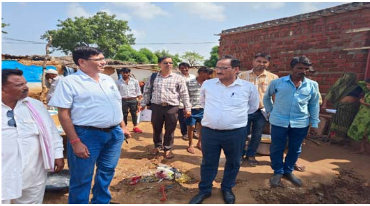
राहत राशि उपलब्ध कराई जायेगी। जिले में अति वर्षा से प्रभावित क्षेत्रों में विद्युत आपूर्ति बहाल करने के इलाकों में बिजली की लाइनें क्षतिग्रस्त हो गई थीं, खंभे गिर गए थे और ट्रांसफार्मर खराब हो गए थे।

लिए विद्युत वितरण कंपनी के मैदानी अमले द्वारा विभिन्न स्थानों पर युद्ध स्तर पर सुधार कार्य किया जा रहा है। जलभराव और तेज बारिश के कारण जिन