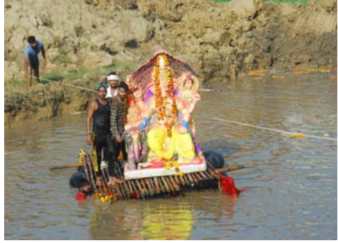
गए भगवान गणेशजी को पूरे श्रद्धाभाव से विदा किया गया। इस बार भी डोल ग्यारस के अवसर पर गाजे बाजे के साथ वही स्कूलों से स्कूली बच्चों ने अबीर गुलाल उड़ते हुए गणपति

बप्पा मोरया, अगले साल फिर आना के जय घोष के साथ गणपति जी का विसर्जन किया जा रहा है। गणेश जी का विसर्जन अनंत चतुर्दशी 16 सितम्बर तक चलेगा। शहर में चलित जलाशयों की व्यवस्था भी की गई है। वहीं गणेश जी की बड़ी मूर्तियों के विसर्जन के लिए सागरताल के पास ही नगर निगम ने वैकल्पिक जलाशय तैयार कर की है। गणेशजी को डोल ताशों और बैंड बाजों के साथ हंसी खुशी लोगों ने सागरताल पहुंचकर विसर्जन कर विदाई दी। डोल ग्यारस पर लोग कटोराल में गणेशजी की छोटी प्रतिमाओं का विसर्जन करने पहुंचे। डोल ग्यारस के दिन शहर में जगह-जगह भंडारों का आयोजन भी हुआ।