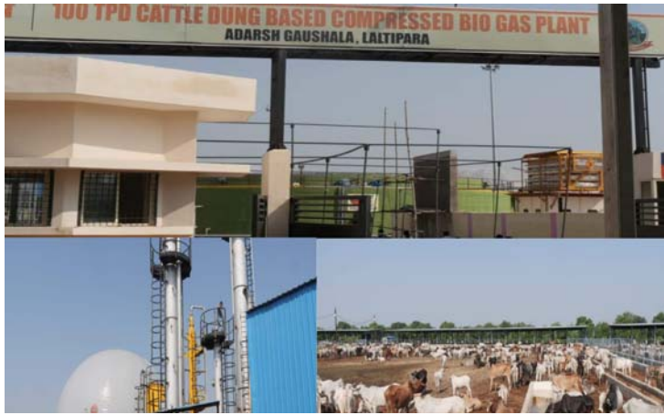
व्या होंगे फायदे

गवालियर देश की पहली आधुनिक और आत्म-निर्भर गौ-शाला गवालियर में लाल टिपारा में तैयार हो गई है। इस गौशाला में इंडियन ऑयल कॉर्पोरेशन के सहयोग से 2 हेक्टेयर क्षेत्र में बायो सी.एन.जी. प्लांट स्थापित हो गया है। इस प्लांट के संचालन के लिए 100 टन गोबर का उपयोग कर प्रतिदिन 3 टन तक सीएनजी और सर्वोत्तम गुणवत्ता का जैविक खाद 20 टन मिलेगा। इंडियन ऑयल कॉर्पोरेशन प्लांट के संचालन एवं संधारण में भी सहयोग करेगा। गौ-शाला में यह सीएनजी प्लांट इंडियन ऑयल कॉर्पोरेशन की सामाजिक जिम्मेदारी निधि से 32 करोड़ रुपये की लागत से बना है। भविष्य में विस्तार की संभावना को रखते हुए एक हेक्टेयर की भूमि आरक्षित रखी गई है। गौ-शाला को और विस्तार देने सांसद निधि से 2 हजार गायों के लिये आधुनिक शेड निर्माण के लिए 2 करोड़ रुपये की राशि दी गई है। मुख्यमंत्री डॉ. यादव ने प्रधानमंत्री श्री नरेन्द्र मोदी और उनकी 'वेस्ट टू वेल्थ' के विकास दर्शन के प्रति आभार व्यक्त किया है। उन्होंने संत समुदाय के प्रति भी आभार व्यक्त किया है जो गौ-माता की सेवा कर रहे हैं। राज्य सरकार इस प्रयास के विस्तार के