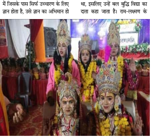
जानता है। हनुमानजी की जीवन में ज्ञान उच्चारण में भी था और आचरण में भी