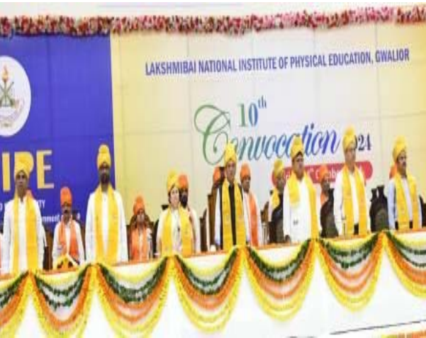
दूसरी पारी में नयी जिम्मेदारी के साथ आगे बढ़ेंगे। वह जिम्मेदार नागरिक के रूप में दूसरी पारी शुरू कर रहे हैं तो हमेशा सीखने की आदत बनाकर रखें। देश, समाज और परिवार के प्रति जिम्मेदारी पूरी करें। डा. मांडविया ने कहा कि फिजिकल

गवालियर। भारत वर्ष की आजादी के एक सौ वर्ष पूरे होने के बाद भारत राष्ट्र को विकसित बनाये जाने का संकल्प लेना चाहिये। इसके लिए देश के नागरिक एक साथ संकल्प लेकर आगे बढ़ें। आज जिन लोगों ने यहां से डिग्री ली है, वह अपने क्षेत्र में जाकर जिम्मेदार नागरिक की तरह संकल्प लेकर कार्य करें। यह बात केंद्रीय खेल मंत्री डा. मनसुख मांडविया ने शुक्रवार को लक्ष्मीबाई राष्ट्रीय शारीरिक शिक्षण संस्थान के दसवें दीक्षांत समारोह को संबोधित करते हुये कही। समारोह में 121 छात्र-छात्राओं को उपाधि प्रदान की गई।