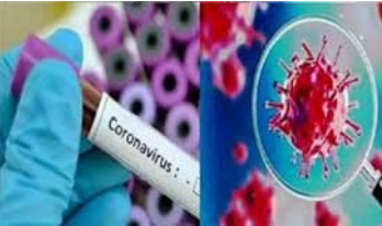
कोविड-19 के मामले बढ़कर 38,53,406 हो गए हैं। वहीं, पिछले 24 घंटे में 1,043 लोगों की मौत के बाद नए संख्या बढ़कर 67,376 हो गई।

नई दिल्ली। भारत में कोरोना के एक दिन में सर्वाधिक 83,883 नए मामले सामने आने के बाद गुरुवार को देश में संक्रमितों की कुल संख्या 38 लाख को पार कर गई। वहीं, अभी तक 29,70,492 मरीजों के ठीक होने से स्वस्थ होने वाले लोगों की दर 77 प्रतिशत के पार पहुंच गई। केंद्रीय स्वास्थ्य मंत्रालय की ओर से सुबह आठ बजे जारी किए गए अद्यतन आंकड़ों के अनुसार देश में