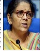
वित्त मंत्री निर्मला सीतारमण ने गुरुवार को बैंकों और एनबीएफस को कहा कि वो 5 सितंबर तक रिजॉल्यूशन प्लान लागू कर दें, कोविड-19 संकट के बीच बिकरने को नियंत्रण करने के लिए इस कदम को लागू किया जा रहा है।

नई दिल्ली। वित्त मंत्री निर्मला सीतारमण ने गुरुवार को बैंकों और एनबीएफस को कहा कि वो 5 सितंबर तक रिजॉल्यूशन प्लान लागू कर दें, कोविड-19 संकट के बीच बिकरने को नियंत्रण करने के लिए इस कदम को लागू किया जा रहा है। वित्त मंत्री ने बैंकों को निर्देश दिए हैं कि वो रिजॉल्यूशन प्लान को 15 सितंबर तक लागू कराएं और 20 सितंबर तक रिजॉल्यूशन प्लान को लागू कराएं और 20 सितंबर तक रिजॉल्यूशन प्लान को लागू कराएं और 20 सितंबर तक रिजॉल्यूशन प्लान को लागू कराएं