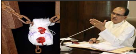
भोपाल। बालाघाट में गरीबों को घटिया चावल बांटने के मामले की जांच आर्थिक अपराध शाखा (ईओडब्ल्यू) करेगी।