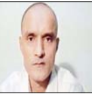
पाकिस्तान की पेशवा का जवाब नहीं दिया है। कोर्ट ने दलीलें सुनने के बाद एक सरकारी को आदेश दिया कि जाधव के मामले में भारत को उसका ऑर्डर भेजा जाए और 3 अक्टूबर तक के लिए केस को सुनवाई स्थगित कर दी। पाकिस्तान जाधव के केस में पुनर्विचार याचिका के लिए इजाजत देने को आर्स्टीव के आदेश पर खास कानून लेकर आया है। भारत ने पाकिस्तान कोर्ट के उस फैसले के खिलाफ आर्स्टीव में अपील की जो विरामे जाधव को सुनवाई चला रही है। अटॉर्नी जनरल खालिद जावेद खान ने दने पर पाकिस्तान के खिलाफ अपील की थी।

इस्लामाबाद। पाकिस्तान की इस्लामाबाद हार्डकोरट ने आज इमरान सरकार को कुलभूषण जाधव के केस में हार्डकोरट दे दिया है। गुरुवार को जारी आदेश में कोर्ट ने कहा कि जाधव के लिए वकील नियुक्त करने का एक और मौका भारत को मिला चाहिए, पाकिस्तान अभी तक इस केस को लेकर कई बार इंटरनेशनल कोर्ट ऑफ जस्टिस के निर्देशों का पालन करने की दुहाई दे चुका है लेकिन उसके सभी दावे खोखले साबित हुए हैं। हार्ड कोर्ट ने केस को सुनवाई भी एक महीने में रिटायर हो जाना चाहिए। नरैतिक अधिकारी जाधव पाकिस्तान को जेल में जामूसी के आरोप में बंद हैं और मौत को सजा के खिलाफ पुनर्विचार याचिका दायिल करने के लिए वकील को नियुक्त के मामले में कोर्ट से कहा कि आर्स्टीव के आदेशों का पालन करते हुए पाकिस्तान ने भारत को राजनयिक पहुंच दी। उन्होंने कोर्ट से यह भी कहा कि भारत ने वकील नियुक्त करने की