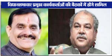
दोपहर 3 बजे अशोकनगर विधानसभा की बैठक में कार्यकर्ताओं को संबोधित करेंगे। सभी बैठकों में गुना के होटल राजविलास में आयोजित होगी। 5 सितंबर शनिवार को प्रदेश अध्यक्ष विष्णुदत्त शर्मा एवं केंद्रीय

भोपाल। भारतीय जनता पार्टी के प्रदेश अध्यक्ष, सांसद विष्णुदत्त शर्मा एवं केंद्रीय मंत्री नरेंद्र सिंह तोमर 4 एवं 5 सितंबर को गुना, शिवपुरी और दतिया जिले के प्रवास पर रहेंगे। निर्धारित कार्यक्रम के अनुसार प्रदेश अध्यक्ष विष्णुदत्त शर्मा एवं केंद्रीय मंत्री नरेंद्र सिंह तोमर 4 सितंबर को गुना पहुंचेंगे। प्रवास के दौरान प्रदेश अध्यक्ष विष्णुदत्त शर्मा एवं केंद्रीय मंत्री नरेंद्रसिंह तोमर विधानसभाओं प्रमुख कार्यकर्ताओं की बैठकों को संबोधित करेंगे। 4 सितंबर शुक्रवार को प्रदेश अध्यक्ष श्री शर्मा एवं केंद्रीय मंत्री श्री तोमर गुना में प्रातः 11 बजे बामोरी, दोपहर 1.30 बजे मुंगवावली,