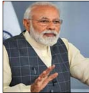
मिशन कर्मयोगी को मंजूरी मिलने के बाद प्रधानमंत्री नरेंद्र मोदी ने ट्वीट कर कहा कि सिविल सर्विस क्षमता निर्माण के लिए राष्ट्रीय कार्यक्रम-

नई दिल्ली। केंद्रीय मॉडर्नइंड ने संस्थागत ढांचे के साथ राष्ट्रीय सिविल सेवा क्षमता विकास कार्यक्रम को शुरू करने को मंजूरी दे दी है। राष्ट्रीय सिविल सेवा क्षमता विकास कार्यक्रम को सिविल सेवकों के लिए क्षमता विकास के लिए आधारशिला रखने हेतु बनाया गया है, ताकि वे भारतीय संस्कृति और संवेदनाओं से सरबोरे रहें और विश्व पर की श्रेष्ठ प्रदर्शियों से सीखें हुए अपनी जड़ों से जुड़े रहें। इस कार्यक्रम को एकीकृत सरकारी ऑनलाइन प्रशिक्षण-आईगैट कर्मयोगी प्लेटफॉर्म की स्थापना करके कार्यान्वित किया जाएगा। मिशन कर्मयोगी को