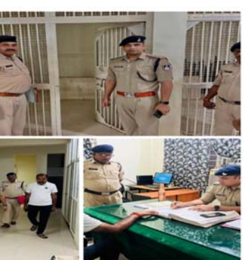
थाना खनियाधाना के एसडीओपीपर की जाने वाली कार्यवाही एवं हावालात को चैक करते हुये थाने पर