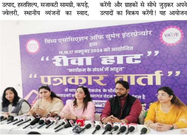
उत्पाद, हस्तशिल्प, सजावटी सामग्री, कपड़े, ज्वेलरी, स्थानीय व्यंजनों का स्वाद, करेंगी और ग्राहकों से सीधे जुड़कर अपने उत्पादों का विक्रय करेंगी! यह आयोजन