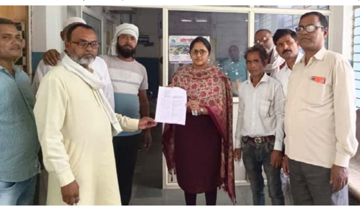
दुकानों के निर्माण कार्य को रुकवाया जाये। (2) उक्त जमीन पर ईदगाह निर्माण की स्वीकृति हुई है, अतः ईदगाह निर्माण कार्य शुरू कराये जाने के लिए खर्दखर्द की जा रही है एवं इनके द्वारा समाज के विरुद्ध कार्य किये जा रहे हैं। अतः इन्हें पद से हटाकर एवं इनके कार्यकाल में इनके द्वारा हुई सभी