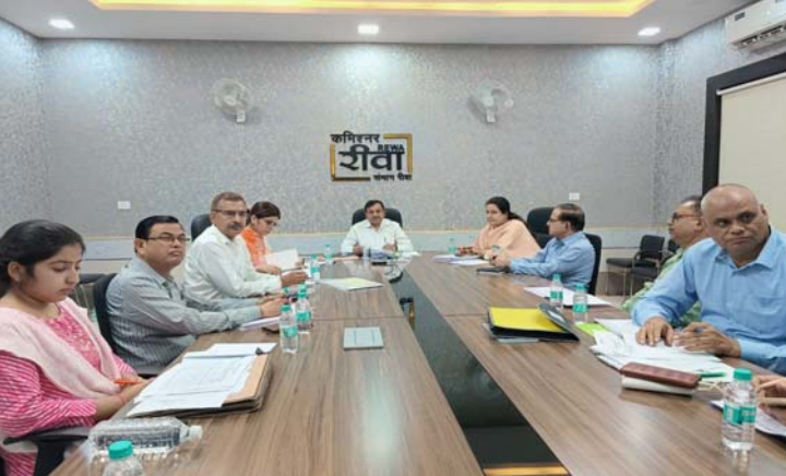
संस्कृतित कर प्रस्तुत करें। साथ ही इन दोनों मोबाइल एप का व्यापक प्रचार-प्रसार कराएं। नरवाई को जलाने से रोकने के लिए किसानों को जागरूक

करें। नरवाई जलाने वाले किसानों के विरुद्ध प्रकरण दर्ज कर जुर्माने की कार्यवाही करें। साथ ही नरवाई को खाद में बदलने के लिए सुपर सीडर एवं हैप्पी सीडर जैसे उपकरणों के उपयोग के लिए