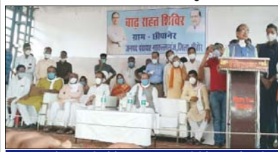
नसरुखगंज के बाढ़ प्रभावित क्षेत्रों का भ्रमण, राहत शिविरों का अवलोकन किया

भोपाल। मुख्यमंत्री श्री शिवराज सिंह चौहान शुक्रवार को सीहोर जिले की नसरुखगंज तहसील के छीपने, रानीपुर, चौरसाखेड़ी एवं भोलेपुर ग्रामों में पहुँचे। उन्होंने बाढ़ प्रभावित क्षेत्रों का अवलोकन किया। मुख्यमंत्री श्री चौहान ने ग्राम छीपने में ग्रामीणों को संबोधित करते हुए कहा कि अतिवर्षा से बड़ी विपत्ति आई है। क्षेत्र में बाढ़ के कारण जन-जीवन अस्त व्यस्त हो गया है। अब हमारी प्राथमिकता लोगों के जीवन को दोबारा सामान्य स्थिति में लाना है। न लगातार प्रशासन के संपर्क में रहें और बाढ़ में फंसे लोगों को हेल्थीकेंटर और नाव के जरिए रेस्क्यू किया। मुख्यमंत्री श्री चौहान ने कहा कि क्षतिग्रस्त मकानों के लिए 1 लाख रुपये की आंशिक रूप से आर्थिक सहायता दी जाएगी। युद्ध स्तर पर बिजली की व्यवस्था दुरुस्त करावाई किमवा, आंधी तक के सारे बिजली के बिल स्थगित कर दिए गए हैं। सोयाबीन व धान सीमा का सर्वे करवाया जाएगा। आरसीसी 6-4 के प्रावधानों के अनुरूप राहत राशि वितरित की जाएगी। गरीबी रक्षा में काम जोड़ने का कार्य किया जाएगा। 50 किलो अनाज प्रत्येक परिवार को वितरित किया जा रहा है। सबल