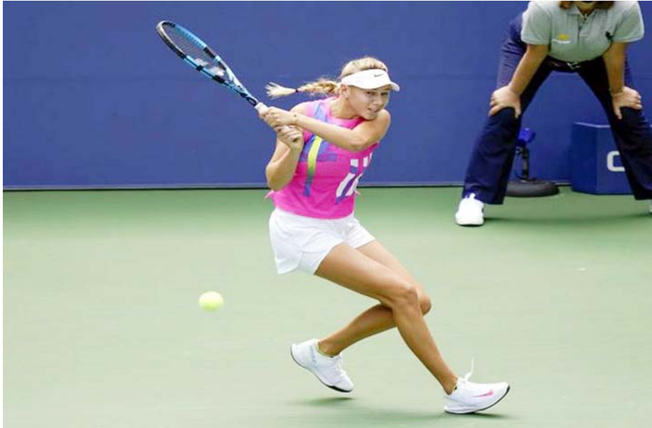
न्यूयार्क में अमेरिकी ओपन टेनिस में खेलती हुई अमेरिका की अमांडा एनीसिमोवा।