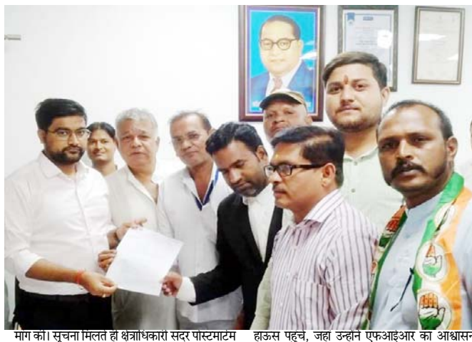
मांग की। सूचना मिलते ही क्षेत्राधिकारी सदर पोस्टमार्टम हाऊस पहुंचे, जहां उन्हेने एफआईआर का आश्वासन