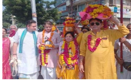
कलश यात्रा के दौरान एक और अन्टी बात देखने को मिली। भी भक्ति भाव से ओतप्रोत हो गए। कलश यात्रा सुबह के वक्त

रिकॉर्डेड गीतों की बजाय सिर्फ भगवान राधा-कृष्ण का संकीर्तन ही सुनने को मिला, जिसे सुन भक्त