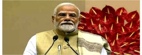
साथ ही इस बात का भरोसा दिलाया कि राज्य सरकार की देखरेख में स्थानीय प्रशासन पीड़ितों को हर संभव सहायता मुहैया कराने में लगा हुआ है। प्रधानमंत्री ने सोशल मीडिया पर कहा कि वे घायलों के

50 हजार का मुआवजा देने की घोषणा की है। उल्लेखनीय है कि राजस्थान के धौलपुर जिले में एक बस और टैपे की धिड़ल में आठ बच्चों सहित 12 लोगों की मौत हो गयी है।