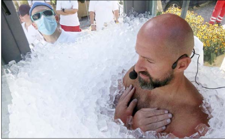
गेल्क में ऑस्ट्रिया के आईस वैरक जोसफ कोइब्रेल बार्थ से भरे एक बॉक्स में बैटकर रिहाई बनाते हुए।