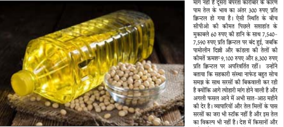
कार्गो चार्जर और देशी तिलहन किसानों के समुहिक के रास्ते पर गोडू अटकोंने वाले आयातकों पर अंकुश लगाना चाहिए। न आयातक किसान एवं तेल उद्योग के विकास को यह में गोडू अटका रहे हैं और बैंकों की गैर-निपादक आशिया बढ़ा रहे हैं। देश का तेल उद्योग दोहरी धार का सामना कर रहा है। एक तो देश में बढ़ते सस्ते आयात के कारण

नई दिल्ली देश में कुछ तेज आयातकों के बेपरवाह कारोबार के कारण बीते सप्ताह दिल्ली तेल-निलतल बाजार में कच्चे पाम तेल (सीओसी) की कीमतों में गिरावट दर्द हुई जबकि तेल रहित खत (डीओसी) के दाम घटने से सोयाबीन दाना और तूब के भाव में भी गिरावट आई। बाजार के जानकार ने कहा कि देश में कुछ आयातक बैंकों से पाम तेल को घुमाने रहने के लिए विशिष्ट से पाम तेल (सीओसी) को जमाकरुब्र महिा दाम पर खरीद करते हैं और देश में मांग न होने के कारण सस्ते में इसकी बिक्री कर रहे हैं। उन्होंने कहा कि सरकार को इस बात को ध्यान में लेते हुए बैंकों के पैसों के बल पर ऐसे बेपरवाह कारोबार करने वालों पर अंकुश लगाना चाहिए। उन्होंने कहा कि वे कारोबारी दिशा में भी और सरकार ने इनपर लाम नहीं कसो, तो देश आविर्भावता को यह पर नहीं बंद पाएंगे। उन्होंने कहा कि सरकार को इस मामले को जांच प्रवर्तन निशाशन में लाने में