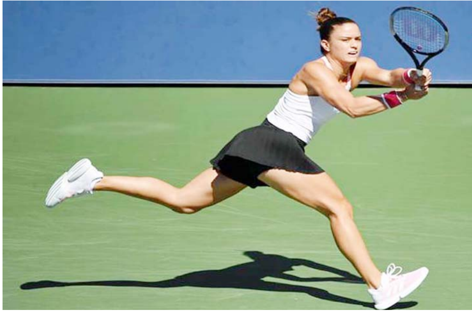
न्यूयार्क में अमेरिकी ओपन टेनिस में बैकहैंड शॉट लगाती हुई मारिया सकाररी।