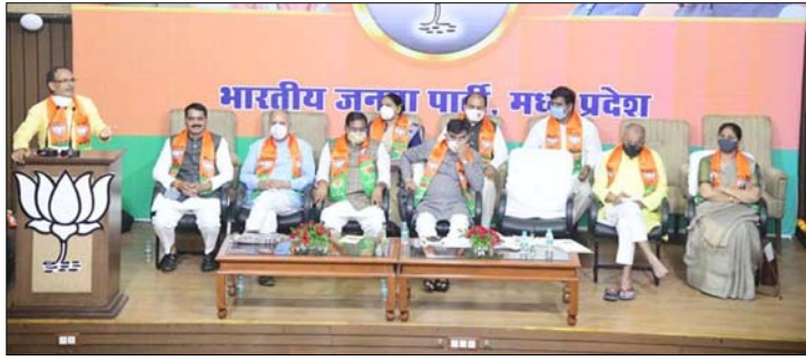
प्रधानमंत्री को परतें खोलकर जनता के सामने रखेंगे शिवराज सिंह चौहान ने कहा कि प्रदेश में बाढ़ के क्षतिग्रस्त के दौरान मैं और भी सारी विधायक/विधायक लगातार जनता के बीच पहुंचें, लेकिन कांग्रेस के नेता अपने बंगलों से बाहर नहीं