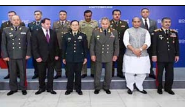
'सौहार्दपूर्ण और गर्मजोशी के माहौल' में हुई। दोनों नेवकों ने भारत और ईरान के बीच खंडीत पुनः संस्कृति, भाषाणी और संस्थागत संबंधों पर जोर दिया। सिंह का ईरान दौरा इस मामले में महत्वपूर्ण है कि उन्होंने यह दौरा फरस को खाड़ी के हालात पर भारत की विचार व्यक्त करते हुए और क्षेत्र के सभी

नेहरू। देश के रक्षा मंत्री राजनाथ सिंह ने रविवार को ईरान रक्षा मंत्री गिोंडियर जनरल आमीर हदामी के साथ मुलाकात की संक्रामक बनावे हुए कहा कि इस टाइट द्विपक्षीय संबंधों को बढ़ाने तथा आगावनिस्तान सहित क्षेत्रीय सुरक्षा से जुड़े मुद्दों पर चर्चा हुई। राजनाथ सिंह शर्वाह हदामी संगठन (एसपीओ) की रक्षा मंत्रियों की बैठक में शामिल होने के बाद अपनी तीस दिवसीय यात्रा के समापन के बाद लंदन लौटे हुए रविवार को नेहरू पहुंचे थे। उन्होंने यात्रा के दौरान, चीनी और मध्य पूर्व-संबंधित देशों के समस्याओं से द्विपक्षीय बतली की थी। सिंह ने ट्वीट किया कि नेहरू ने ईरानी रक्षा मंत्री गिोंडियर जनरल आमीर हदामी से 'अंतर-संक्रामक' मुलाकात हुई। हमें अपमानितान सहित क्षेत्रीय सुरक्षा और द्विपक्षीय सहयोग पर चर्चा की।' रक्षा मंत्री के कार्यालय ने एक अन्य ट्वीट में ईरान के रक्षा मंत्री के अनुपस्थित पर लिखा कि 'हूँ केक के नों से बचें, 'जों रक्षा मंत्रियों ने द्विपक्षीय सहयोग को जों बढाने पर चर्चा की तथा आगावनिस्तान में शांति और स्थिरता सहित क्षेत्रीय सुरक्षा के मुद्दों पर विचारों का आदान-प्रदान किया।' अंत में कहा कि दोनों मंत्रियों की बैठक बहुत ही