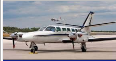
इंदौर प्रदेश में अबल, अभी से रहा 34 उड़ानों का परिचालन

भोपाल। कोरोना काल में थमा प्रदेश के इंदौर शहर के देवी अहिल्याबाई होलकर अंतरराष्ट्रीय एयरपोर्ट से घरेलू उड़ानों का सिलसिला फिर से प्रारंभ हो गया है। वर्तमान में इंदौर से 34 उड़ानों का परिचालन हो रहा है, जो प्रदेश में सबसे अधिक है। इस माह के अंत तक यह आंकड़ा 40 से अधिक हो जाएगा। लोक शिक्षण संचालनालय के जारी आंकड़ों के मुताबिक प्रवेश प्रक्रिया में छिंदवाड़ा सहित 16 जिलों में अबल है। इस जिलों में 90 प्रतिशत विद्यार्थियों को स्कूलों में प्रवेश दिया गया है। लोक शिक्षण संचालनालय को प्रदेश के जिलों में कक्षा एक से लेकर 12वीं तक के सरकारी स्कूलों में प्रवेशित बच्चों की संख्या 1 करोड़ 30 लाख है, जबकि पिछले साल स्कूलों में 1 करोड़ 43 हजार बच्चे प्रवेशित हैं। लोक शिक्षण संचालनालय अधिकारियों का कहना है कि जिलों द्वारा सही जानकारी नहीं भेजने पर आंकड़ों पर अंतर आ रहा है।