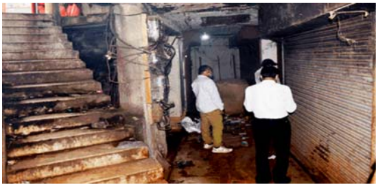
सुनते ही दुकानदार पीछे हट गए और उन्होंने सामान निकालना शुरू कर दिया। दोपहर बाद निगम अमले ने गैस कट्टर से शहर काटना शुरू कर दिए। 25 दुकानों में 32 शहर थे जिनमें से 24 को काट दिया। शहर कटते ही निगम