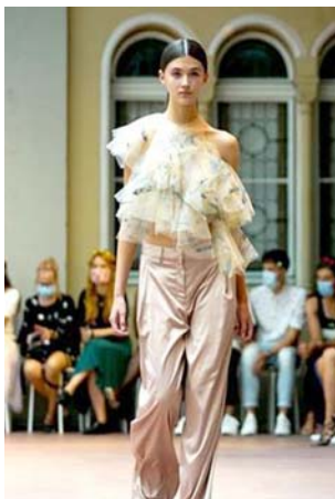
प्राग में फैशन वीक में परिधानों को पेर