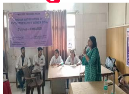
अंतर्गत समस्त माताओं के सम्पूर्ण चेकअप की व्यवस्था की गई एवं आवश्यकतानुसार चिकित्सा माताओं का यूसूजी भी सुनिश्चित कराया जाएगा।