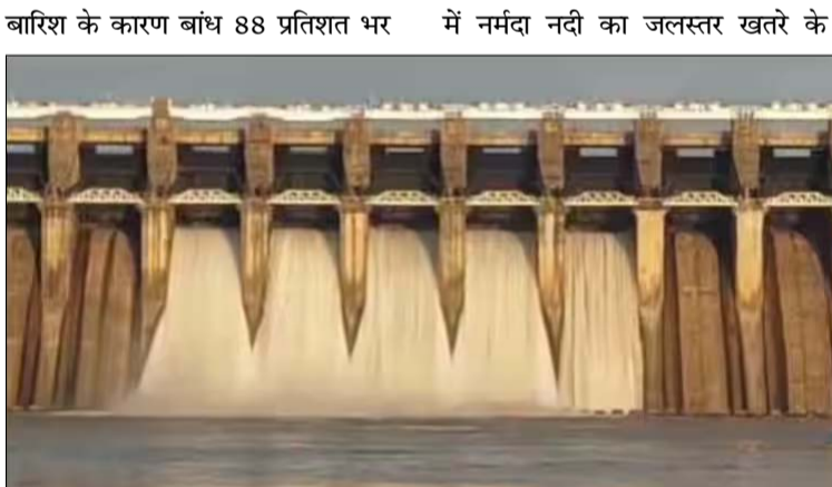
चुका है. बांध के बैक वाटर से मंडला निशान से ऊपर हो गया है.

राजधानी भोपाल सहित आसपास के जिलों में लगातार बारिश का दौर जारी है. जिसकी वजह से डैमों के गेट खोले जा रहे हैं. आज दोपहर 1 बजे रानी अवंति बाई लोधी सागर परियोजना बरगी बांध के जल स्तर को नियंत्रित करने के लिए इसके चार स्मिल-वे गेट खोले जाएंगे. जल निकासी की मात्रा बढ़ाकर 13 गेटों से 1 लाख 12 हजार 160 क्यूसेक पानी की निकासी की जाएगी.