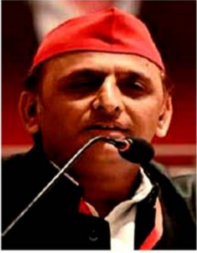
मायावती ने पलटवार करते हुए सोशल मीडिया एक्स के माध्यम से लिखा कि यूपी सरकार द्वारा अयोध्या के गैंगपर केस में आरोपी के विरुद्ध की जा रही सख्त कार्रवाई उचित, लेकिन सपा द्वारा यह कहना कि आरोपी का डीएनए टेस्ट होना चाहिए, इसे वया समझा जाए। जबकि सपा को यह भी बताना चाहिए कि उनकी सरकार में ऐसे आरोपियों के खिलाफ कियेने डीएनए टेस्ट हुए हैं।