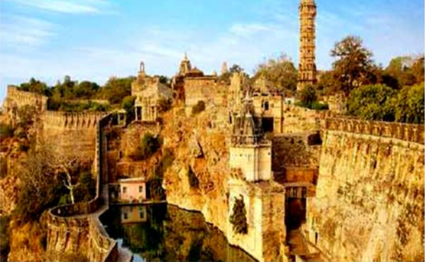
कोई दुर्घटना घटित ना हो और कानून व्यवस्था प्रभावी ना हो इसके लिए हरियाली अमावस्या को देखते हुए दुर्ग पर समस्त प्रकार के वाहनों पर रोक लगाई गई है। वृत्ताधिकारी