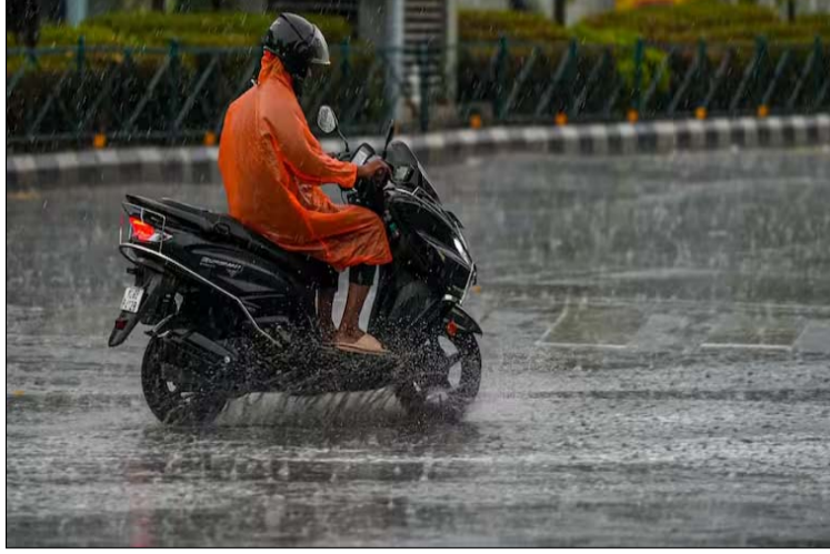
इन जिलों में होगी बारिश

इन जिलों में होगी मध्यम बारिश -मौसम विभाग के मुताबिक, मध्य प्रदेश के कुछ जिलों में मध्यम बारिश होगी. जिनमें विदिशा, इंदौर, खांडवा, उज्जैन, मंडला, उमरिया, डिंडोरी, शहडोल, सतना, छतरपुर जिले शामिल हैं.