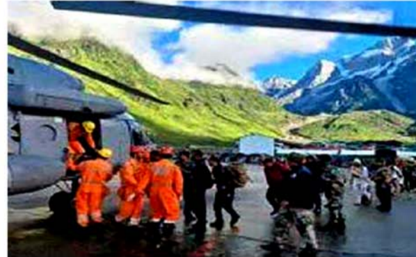
ही राव लिंकोली क्षेत्र से बरामद हुए हैं। किसी के गुरुमुखी होने की कोई सूचना नहीं है। नेटवर्क कनेक्टिविटी की समस्या के कारण यात्रियों को परिजनों से संपर्क करने में समस्या

रुद्रप्रयाग। उत्तराखंड के केदार घाटी में बुधवार रात्रि को हुई अल्ट्राचिक बाँरि के कारण केदार घाटी में कई जगह रास्ते क्षतिग्रस्त हुए हैं। विभिन्न पड़वालों पर फंसे तीर्थयात्रियों एवं स्थानीय लोगों को सुरक्षित रेस्क्यू करने के लिए जिला प्रशासन व पुलिस सहित अन्य सुरक्षा बल लगातार कार्य कर रहे हैं। अब तक कुल 7234 यात्रियों को हेलीकॉप्टर एवं मैनुअल तरीके से रेस्क्यू कर सुरक्षित निकला गया है। हर स्तर पर सभी लोगों को सुरक्षित रेस्क्यू करने के लिए प्रयास किए जा रहे हैं। बचाव कार्यों में वेजी लाने हेतु वायु सेना का चिनूक एवं एमआर 17 विमान से भी यात्रियों को एयर लिफ्ट किया गया। वहीं मैनुअल रेस्क्यू भी लगातार जारी है। आग्यों एवं गुरुमुखी यात्रियों के संबंध में रुद्रप्रयाग प्रशासन द्वारा स्थिति स्पष्ट करते हुए बताया गया है कि अभी तक दो मृतकों के शव बरामद हुए हैं। दोनों