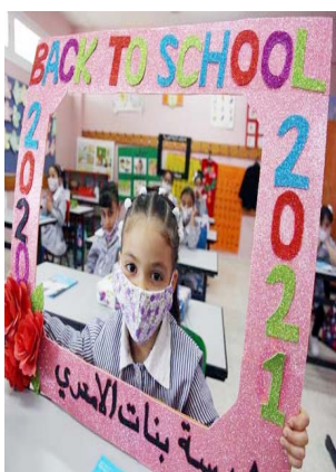
फिलिस्तीनी शहर रमहल्ल में कोरोना महामारी के कारण छह माह से बंद स्कूल फिर खुल गये।

बदलने की कोशिश की। ड्रैगन को इस नापाक साजिश को भारतीय सेना ने जोरदार कार्रवाई करते हुए विफल कर दिया।