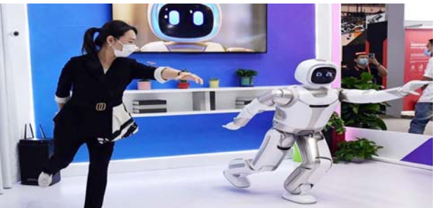
बीजिंग में लगे एक ट्रेड फेयर के दौरान एक रोबोट को गिरदेश देती हुई एक महिला।

लंदन। ब्रिटेन के प्रधानमंत्री बोरिस जॉनसन ने यूरोपीय संघ के साथ अंतिमंथन के बाद की व्यापार वार्ता के अंतिम चरण से पहले विचारों की सूझ सूझ अपनी हूए कहा कि ब्रिटेन कुछ हफ्तों के भीतर वार्ता से बाहर हो सकता है। साथ ही उन्होंने कहा कि कोई सौदा नहीं होने की मूलतः बाहर होना ब्रिटेन के लिए अच्छा परिणाम देने वाला होगा। वार्ता में परिधि बनने वाले के बीच जॉनसन ने कहा कि समझौता तभी संभव है, जब यूरोपीय संघ के वार्ताकार अपनी मौजूदा स्थिति पर फिर से विचार करने के लिए तैयार हों। वहीं ड्यू ब्रिटेन पर भीतर से वार्ता