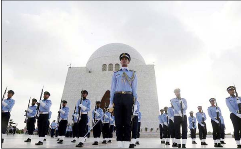
पाकिस्तान के कराची शहर में देश के संस्थापक जिन्ना की याद में आयोजित रक्षा दिवस में भाग लेते हुए कैडेट्स।