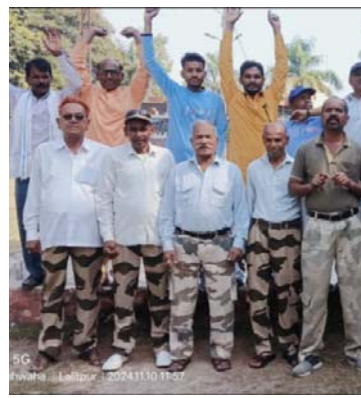
की जा रही है जो कि सर्वथा अनुचित है। बु. वि. सेना के जिला कमांडेंट सुधेश नायक ने कहा अत्यधिक तेज गति से घूमता है जिस कारण उपभोक्ता की जेबों पर भारी-भरकम बोझ पड़ेगा। अतः-उक्त कंपनी

रही है। प्रदेश के इस अति पिछड़े जिले पर यह जबरन थोपकर उपभोक्ताओं की जेबों पर डाका डालने की तैयारी कि उक्त जीएस कंपनी द्वारा प्रस्तावित प्रीपेड स्मार्ट मीटर मानकों के विपरीत है एवं उनकी मीटर रीडिंग का पहिया