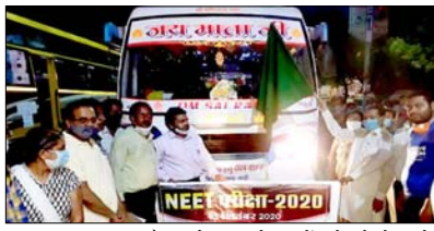
रवाना हुए। व्यवस्था के चलते बच्चे न केवल समय पर अपने केन्द्र पर पहुँचकर परीक्षा दे सकें बल्कि अपने घर रवाना होने से