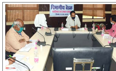
में प्रदेश के श्रमिकों और प्रवासी श्रमिकों के लिये बहुत कार्य किये हैं। श्रमिकों के लिये भोजन व्यवस्था, रोजगार की उपलब्धता के साथ उन्हें

भोपाल। खनिज साधन एवं श्रम मंत्री श्री बुजेंद्र प्रताप सिंह ने विभागीय अधिकारियों को निर्देश दिये कि श्रमिकों के हित में शासन द्वारा चलाई जा रही योजनाओं का प्रभावी क्रियान्वयन सुनिश्चित किया जाये। श्रमिकों को योजनाओं का लाभ सहज रूप से मिले, इसके लिये अधिकारी स्वतः उनके सम्पर्क में रहे। खनिज अधिकारियों को निर्देश दिये गये कि किसी भी जिले में खनिज का अवैध परिवहन, उखनन एवं भण्डारण न हो। इसे सख्ती से रोका जाये और दूषी के विरुद्ध कार्यवाही करें। श्रम मंत्री श्री सिंह ने रविवार को ग्वालियर मुख्यालय में ग्वालियर एवं चंबल संभाग के अधिकारियों को बैठक लेकर विभागीय समीक्षा की। उन्होंने कहा कि मुख्यमंत्री श्री शिवराज सिंह चौहान ने कोरोना काल