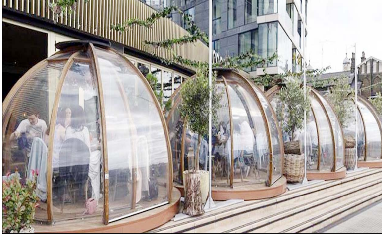
लॉन्ग के एक रेस्टोरेट में कोरोना महामारी के खतरों को देखते हुए सुरक्षा के सिद्धान्त से हर सगुरु को एक दूसरे से अलग रखा गया।