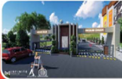
• ANJANI DHAM PHASE 1