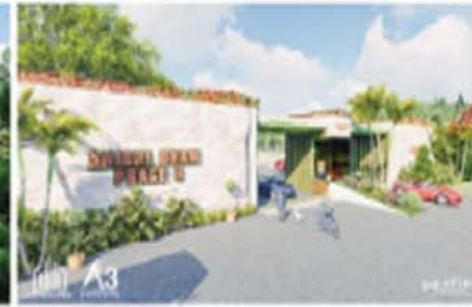
• ANJANI DHAM PHASE 3