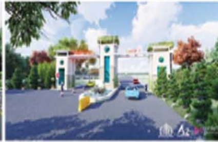
• ANJANI DHAM PHASE 2