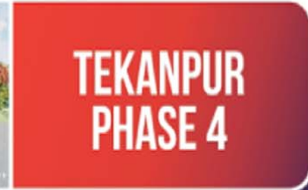
• ANJANI DHAM PHASE 4

रियल एस्टेट इंडस्ट्री में पहली बार CCA ग्रुप लेकर आये हैं मात्र 85 RS प्रतिदिन में प्लॉट पहले आएँ पहले पायें ऑफर सीमित समय के लिए उपलब्ध