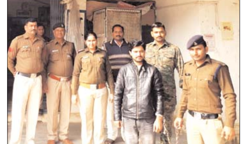
प्रदीप राजावत ब्यूरो

विजयदिवस पर शासकीय भवनों पर शैशवी की जारोगी मुरैना। आगामी 16 दिसंबर को विजय दिवस के अवसर पर सभी प्रमुख शासकीय भवनों में प्रकाश की व्यवस्था किये जाने के निर्देश शासन द्वारा दिये गये हैं।