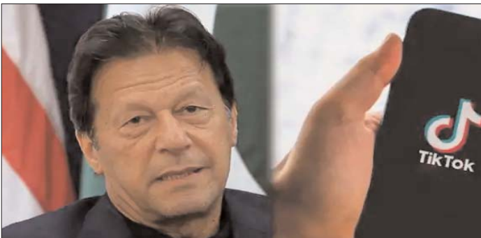
आउटलेट्स, सोशल मीडिया और ऐप्स के जरिए फैल रही अश्लीलता को रोकने के लिए व्यापक रणनीति

उनके साथ इस मुद्दे पर एक या दो बार नहीं बल्कि 15-16 बार चर्चा की है। वह समाज में मुख्यधारा के