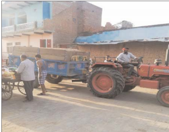
स्थानीय प्रशासन की कार्यप्रणाली पर प्रश्नचिह्न लगा रहा है क्योंकि कि रेत के ट्रैक्टर दिन दहाड़े व रात में भी थाने के सामने से ही होकर गुजरते हैं फिर भी प्रशासन चुप्पी साधे हुए हैं, आखिर माजरा क्या है यह तो कह पाना मुश्किल है क्योंकि

दबोह। गर दबोह में खुले आम पुलिस प्रशासन की आंखों के सामने रेत का अवैध कारोबार काफी अच्छे से फल फूल रहा है, परन्तु यहाँ कार्यवाही के नाम पर सिर्फ वरिष्ठ अधिकारियों को ठेगा दिखाया जाता है। दबोह नगर में खुले आम खनन कारोबारियों द्वारा अवैध रेत का विक्रय किया जा रहा है। यहाँ रेत कारोबार न तो नियमों का पालन कर रहे हैं और न ही सरकार को रॉयल्टी चुका रहे हैं। जिससे सरकार के राजस्व को प्रतिदिन लाखों रुपये की चपत लग रही है जिसका श्रेय सिर्फ स्थानीय पुलिस प्रशासन को जाता है क्योंकि कि नगर के आस-पास के अंचल के अन्य कई गांवों की छोटी-बड़ी नदियों में रेत का अवैध खुदाई का कार्य जारी है। नगर में रेत का यह कारोबार खुले आम फलफूल रहा है, व रेत का अवैध कारोबार नगर में तेजी से बढ़ता दिख रहा है क्योंकि कि नगर में रोजाना दिन दहाड़े दर्जनों ट्रैक्टरों से रेत का आदान प्रदान जो चल रहा है जिसका जीता जाता जागता सबूत कभी भी रात 8 बजे ही रेत देखने को मिल सकता है। खनन कारोबारी रेत का यह कारोबार बेखोफ होकर दिन के उजाले में व रात बड़ी मात्रा में खुले आम विक्रय करते हैं फिर भी कार्यवाही न होना