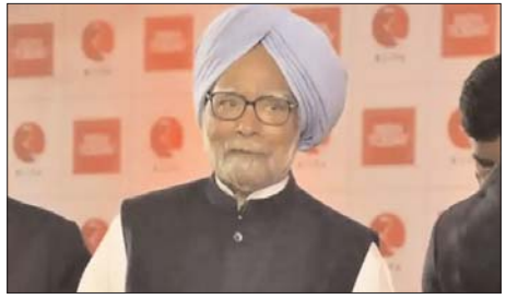
मनमोहन सिंह का जन्म 26 सितंबर, 1932 को

दी थी, क्योंकि उन्होंने उस समय भारत की अर्थव्यवस्था के बारे में पूरी तरह से समझा था। मनमोहन सिंह के जीवन से जुड़ी खास बातें