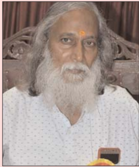
तुम तो योगी थे...! ढोंगी कैसे हो गए...!

ऐसी क्या मजबूरी थी जो उसे रात को ही जबरन जला दिया जब वह जीवित थी तब तुम्हारी सरकार ने उसे सुरक्षा नहीं दी। जब उस पर हमला हुआ तब तुम्हारी सरकार सो रही थी और इंसानियत रो रही थी तुमने समय पर उसे इलाज भी नहीं दिया तुमने परिजनों से ही नहीं ऐसी हर मजलूम बेटी के अंतिम संस्कार का अधिकार छीना है यह घोर अमानवीयता नहीं तो और क्या है...? सच कहूँ तो तुमने अपराध रोका ही नहीं बल्कि अपराधियों की तरह व्यवहार किया है... एक पवित्र रंग की आड़ में अपने निहित स्वार्थों की खातिर भूखे भेड़िये बन गए हो तुम तुम्हारी ये अस्थायी सलतनत एक मासूम बच्चों के साथ की गई धिनोनी दरिद्री की गुन्हागार है...! हथियार का यह हद्दसा तब तक नहीं मरेगा तब तक मासूम बेटी को इंसाफ नहीं मिलेगा... जब तक जुल्मी जालिमों की गर्दनोँ पर फाँसी का फंदा नहीं लगेगा...!