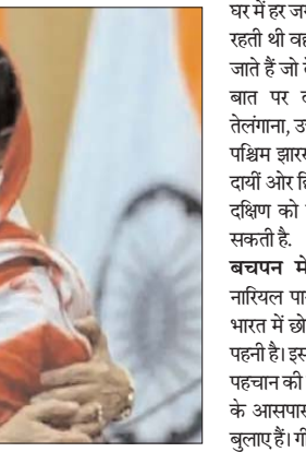
पाकिस्तान पहुंच गई। उसके घर में इडली-सांभर और डोसा बनता था।