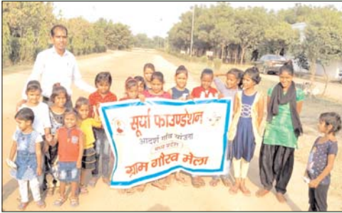
आदर्श गांव योजना के अंतर्गत देश भर में 18 राज्यों के 365 गांव में ग्राम गौरव मेला कार्यक्रम कराने का लक्ष्य