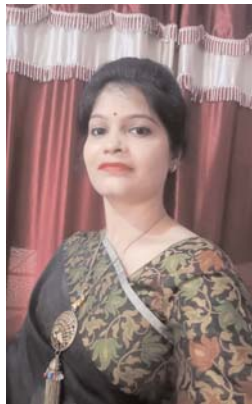
मीरा, सची, सुलोचना, राधा, सीता नाम, दुर्गा, काली, द्रौपदी, अनसुइया सुख धाम। मर्यादा गहना बने, सजती नारी देह, संस्कार को पहनकर, स्वर्णिम बनता गेह। पिया संग है कामनी, मातुल सुत के साथ, सास-ससुर को सेवती, रुके कभी न हथ। सारिका जागृति की कलम से सर्वाधिकार सुरक्षित ज्वालियर (मध्य प्रदेश)

नारी की अवहेलना, नारी का अपमान। मां-बेटी-पत्नी-बहन, नारी रूप हजार, नारी से रिश्ते सजे, नारी से परिवार। नारी बीज उगाते हैं, नारी धरती रूप, नारी जग सृजित करे, धर-धर रूप अनुप। नारी जीवन से भरी, नारी वृक्ष समान, जीवन का पालन करे, नारी है भगवान। नारी में जो निहित है, नारी शुद्ध विवेक, नारी मन निर्मल करे, हर लेती अविवेक। पिया संग अनुगामिनी, ले हाथों में हाथ, सात जनम की कसम, ले सदा निभाती साथ। हर युग में नारी बनी, बलिदानों की आन, खुद को अर्पित कर दिया, कर सबका उत्थान। नारी परिवर्तन करे, करती पशुता दूर, जीवन को सुरक्षित करे, प्रेम करे भरपूर। प्रेम लुटा तन-मन दिया, करती है बलिदान, ममता की वर्षा करे, नारी घर का मान।