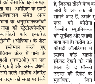
नासा की स्पेक्ट्रोस्फीयरिक ऑब्जर्वेटरी फॉर इन्फ्रारेड एस्ट्रोनोमी (सोफिया) के डेटा का इस्तेमाल करते हुए क्लेवियस क्रैटर में पानी के अणुओं (एच2ओ) का पता लगाया है।