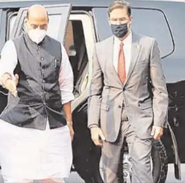
खाका तैयार किया जाएगा। अमेरिका में तीन नवंबर को राष्ट्रपति पद के लिए चुनाव होना है और यह चुनाव से पहले टू-प्लस-टू वार्ता की आखिरी

विश्व के दो बड़े लोकतांत्रिक देशों के बीच वैश्विक सहयोग की दिशा में हुई प्रगति की समीक्षा की जाएगी और आगे उठाए जाने वाले कदमों का