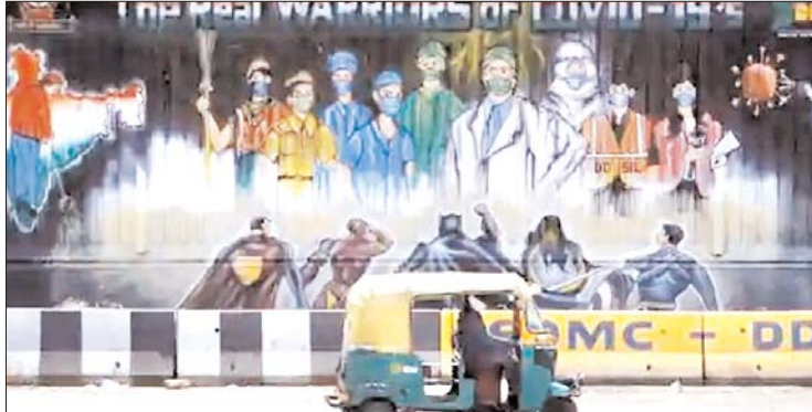
तरह से देखा जाए तो सितंबर के मध्य में ही देश में कोरोना का पीक खत्म हो चुका है। भारत में इस महीने में दूसरी

बढ़कर 79,09,959 हो गए हैं। वहीं 480 और लोगों की मौत के बाद मृतक संख्या बढ़कर 1,19,014 हो गई। कोरोना का भारत में नया रिकॉर्ड, पिछले 24 घंटे में 49,300 नए केस-मंत्रालय के मुताबिक, 71,37,228 लोगों के संक्रमण मुक्त होने के बाद देश में मरीजों के ठीक होने की दर बढ़कर 90.23 प्रतिशत हो गई है। वहीं कोविड-19 से मृत्यु दर 1.50 प्रतिशत है। देश में अभी सात लाख से कम लोगों का इलाज जारी है। आंकड़ों के अनुसार देश में अभी 6,53,717 मरीजों का इलाज जारी है, जो कुल मामलों का 8.26 प्रतिशत है। भारत में सात अगस्त को संक्रमितों की संख्या 20 लाख के पार चली गई थी, 23 अगस्त को 30 लाख और पांच सितंबर को संक्रमितों की संख्या 40 लाख के पार चली गई थी। कुल मामले 16 सितंबर को 50 लाख के पार, 28 सितंबर को 60 लाख और 11 अक्टूबर को 70 लाख के पार चले गए थे। भारतीय आयुर्विज्ञान अनुसंधान परिषद (आईसीएमएआर) के अनुसार 25 अक्टूबर तक कुल 10,34,62,778 नमूनों की कोविड-19 की जांच की गई, जिनमें से 9,39,309 नमूनों का परिणाम रविवार को ही किया गया।