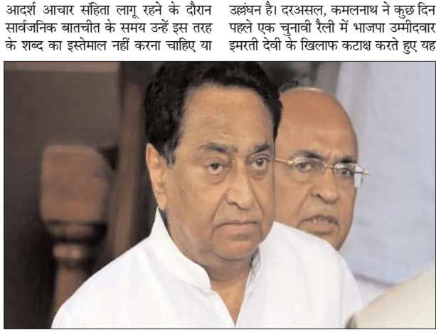
ऐसे बयान नहीं देना चाहिए। आयोग ने कहा कि कमलनाथ ने एक महिला के लिए आइटम शब्द का इस्तेमाल किया और यह आचार संहिता संबंधी आयोग द्वारा जारी परामर्श का

भोपाल। मध्य प्रदेश की 28 विधानसभा सीटों पर होने वाले उपचुनाव को लेकर सियासी सरगर्मियां तेज हैं। नेताओं के बीच जुबानी जंग इस कदर बढ़ गई है कि मामला चुनाव आयोग तक पहुंच गया है। कमलनाथ के आइटम बयान के बाद कैलाश विजयवर्गीय चुनू-मुनू वाली टिप्पणी पर चुनाव आयोग हरकत में आया है और नोटिस जारी किया है। एक ओर जहां कमलनाथ को चुनाव आयोग ने उनके बयान पर नसीहत दी है तो दूसरी ओर विजयवर्गीय को नोटिस जारी कर जवाब देने को कहा है। चुनाव आयोग ने सोमवार को कहा कि मध्य प्रदेश के पूर्व मुख्यमंत्री कमलनाथ ने भाजपा की महिला उम्मीदवार के खिलाफ आइटम शब्द का इस्तेमाल कर प्रचार के संबंध में उसके परामर्श का उल्लंघन किया। आयोग ने कांग्रेस नेता को आदर्श आचार संहिता की अवधि में सार्वजनिक तौर पर इस तरह की भाषा का इस्तेमाल नहीं करने की सलाह दी। आयोग ने सोमवार को कांग्रेस नेता के खिलाफ आदेश जारी किया। आदेश में कहा गया, आयोग मध्यप्रदेश के पूर्व मुख्यमंत्री कमलनाथ को सलाह देता है कि