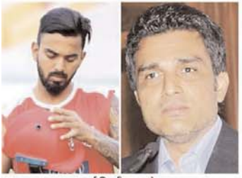
नई दिल्ली 3 अक्टूबर।

ऑस्ट्रेलिया दौरे के लिए टेस्ट टीम में केएल राहुल को चुने जाने पर पूर्व भारतीय क्रिकेटर संजय मांजरेकर ने अपनी नाराजगी जाहिर की है। बीसीसीआई ने नवंबर के आखिरी सप्ताह से शुरू होने जा रहे आगामी अंतरराष्ट्रीय सीरीज के लिए टी20, टेस्ट और वनडे मैचों के लिए टीम का ऐलान कर दिया है। जहां तक लोकेश राहुल का सवाल है, वे इस वक्त अपने शानदार फॉर्म में चल रहे हैं। इंडियन प्रीमियर लीग (आईपीएल) 2020 में किंग्स इलेवन पंजाब की कप्तानी कर रहे लोकेश राहुल अरिज कैप की दौड़ में सबसे आगे हैं। इतना ही नहीं वे टूर्नामेंट में किसी टीम के खिलाफ सर्वाधिक निजी स्कोर बनाने वाले इकलौते कप्तान भी हैं। लोकेश ने यह रिकॉर्ड रॉयल चैलेंजर्स बेंगलूर के खिलाफ दुबई इंटरनेशनल क्रिकेट स्टेडियम में बनाया था, जहां उन्होंने 132 रनों की नाबाद पारी खेली थी। फिर भी, उनके आईपीएल खेलों को ध्यान में रखते हुए टेस्ट टीम में उनका चुनाव संजय मांजरेकर को राम नहीं आया। राहुल ने अपना आखिरी टेस्ट मैच जमैका के किंग्स्टन में वेस्टइंडीज के खिलाफ अगस्त 2019 में खेला था। अब तक खेले गए 36 मैचों में उनका औसत स्कोर 34.58 का है, जो वह दिखाता है कि क्रिकेट के इस लंबे फॉर्मेट में वे अपने बल्ले से कुछ खास नहीं कर सके हैं। 2014 में डेब्यू करने वाले राहुल के नाम पांच शतक और 11 अर्धशतक हैं।