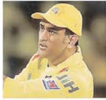
चैलेंजर्स बेंगलूर को 8 विकेट से हरा दिया। लेकिन एक अन्य मैच में राजस्थान रॉयल्स ने मुंबई इंडियंस