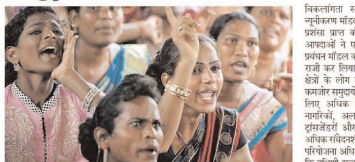
कार्यक्रम के कार्यान्वयन पर विचार कर रहा है, जो देश में अपनी तरह का पहला कार्यक्रम है। केरल, जिसे हाल में दो बाढ़ों का सामना करना पड़ा था, पहले से ही एक सफल

ट्रांसजेंडर समुदाय जल्द ही केरल में आपदा प्रबंधन में महत्वपूर्ण भूमिका निभाएगा, क्योंकि राज्य सरकार देश में पहली बार इसे हाथिए के समूह में शामिल करने के लिए कदम कस रही है। आधिकारिक सूत्रों ने कहा कि प्राधिकरण अपने आपदा प्रबंधन कार्यक्रम में तीसरे नंबर पर रांगिंग कर रहे हैं और आपात स्थिति के दौरान अपने-अपने सेवाओं का उपयोग कर रहे हैं, इसके अलावा अपनी आपातकालीन प्रतिक्रिया क्षमताओं और अस्तित्व कौशल को मजबूत कर रहे हैं। हाल के दिनों में बढ़ती प्राकृतिक आपदाओं के मद्देनजर, राज्य आपदा प्रबंधन प्राधिकरण (एसडीएमए) राज्य में एक ट्रांसजेंडर-समावेशी आपदा जोखिम न्यूनीकरण