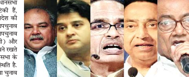
ज्योतिरादित्य सिंधिया, दिव्यजय सिंह कई और दिग्गज नेताओं के लिए और नरेन्द्र सिंह तोमर सहित राज्य के महत्वपूर्ण हैं।

भोपाल/पटना। बिहार विधानसभा चुनाव पर सबकी नजरें टिकी हैं, लेकिन 3 नवंबर की मध्य प्रदेश की 28 सीटों के लिए होने वाले उपचुनाव भी कम अहम नहीं हैं। ये उपचुनाव भारतीय जनता पार्टी (बीजेपी) और कांग्रेस दोनों के लिए बहुत मायने रखते हैं। बीजेपी की मौजूदा विधानसभा के अंकगणित में आरामदायक स्थिति है, वहीं कांग्रेस 2018 विधानसभा चुनाव में सबसे बड़ी पार्टी के तौर पर उभरी थी, तब कांग्रेस ने कमलनाथ के नेतृत्व में सरकार भी बनाई, लेकिन वो इस साल मार्च में गिर गई। ऐसा ज्योतिरादित्य सिंधिया की अपने 22 समर्थक विधायकों के साथ बगवत और फिर बीजेपी से हाथ मिलाने की वजह से हुआ। तब से राज्य में शिवराज सिंह चौहान के नेतृत्व में बीजेपी सरकार है। ये उपचुनाव शिवराज सिंह चौहान और कमलनाथ के साथ-साथ