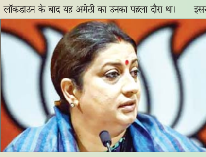
लॉकडाउन के बाद यह अमेठी का उनका पहला दौरा था।

नई दिल्ली। केन्द्रीय मंत्री स्मृति ईरानी कोरोना पॉजिटिव पाई गई हैं। उन्होंने गुरुवार को यह जानकारी ट्वीट के जरिए दी। इसके साथ ही उन्होंने अपने संपर्क में आए लोगों से जल्द जांच कराने को कहा है। स्मृति ने ट्वीट करते हुए कहा- इस बात का ऐलान करने के लिए शब्दों का चयन मेरे लिए दुर्भ है। इसलिए इसे साधारण रखते हुए कहती हूँ कि मेरा कोविड-19 टेस्ट पॉजिटिव पाया गया है और उन लोगों से अनुरोध करना चाहूंगी जो मेरे संपर्क में आए हैं वे जल्द से जल्द अपनी जांच करावा लें। केन्द्रीय महिला एवं बाल विकास मंत्री ने पिछले हफ्ते अपने संसदीय क्षेत्र अमेठी का भी दौरा किया था, जहां पर उन्होंने अपने लोकसभा क्षेत्र के लिए कई परियोजनाओं का ऐलान किया था। कोरोना वायरस रोकथाम के लिए मार्च में लगाए गए