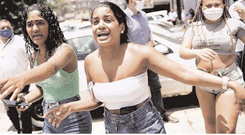
रियो डि जिनेरियो में एक कोविड-19 वाले अस्पताल में लगी आग के कारण ध्वंसावृत्त हुए उनके परिजन।