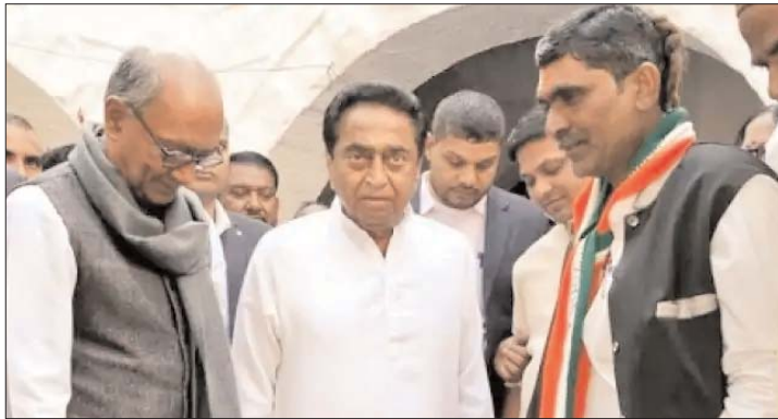
पर चुनाव लड़ रहे हैं। ऐसे में पार्टी ने इन सीट पर की ग्वालियर चंबल क्षेत्र की सीट पर भी खास

उम्मीदवार बहुत कम अंतर से जीते थे। इस बार सभी विधायक पाला बदलकर भाजपा के टिकट अपना दबदबा बनाए रखने के लिए हर सीट पर कई नेताओं को तैनात किया है। इसके साथ पार्टी