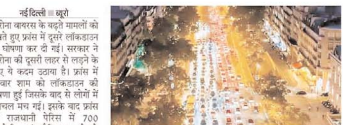
नई दिल्ली। यूरोप में कोरोना वायरस के बढ़ते मामलों को देखते हुए फ्रांस में दूसरे लॉकडाउन की घोषणा कर दी गई। सरकार ने कोरोना की दूसरी लहर से लड़ने के लिए ये कदम उठाया है। फ्रांस में गुरुवार शाम को लॉकडाउन की घोषणा हुई जिसके बाद से लोगों में हलचल मच गई। इसके बाद फ्रांस की राजधानी पेरिस में 700 किलोमीटर लंबा ट्रैफिक जाम देखने को मिला। लोग अपना सामान लेकर अपने परिवार-दोस्तों के पास और जरूरी सामान खरीदने के लिए जा रहे थे। आस-पास के इलाकों को जोड़कर देखते हैं तो मालूम चलता है। ये जाम 700 किलोमीटर तक लंबा था। कहा जा रहा है इस लंबे जाम का कारण लगने वाला नया लॉकडाउन था। जिसकी वजह से लोगों को एक महीने तक अपने घर के अंदर रहना होगा। लोग इस घोषणा के प्रभावों होने

से पहले ही अपनी गाड़ियां उठाकर निकल पड़े। जिस कारण ये जाम लग गया। जाम लगने का दूसरा बड़ा कारण था इस वीकेंड पर पड़ने वाला सेंट्स डे हॉलीडे। इसलिए लोगों ने जाने में ज्यादा तेजी दिखाई। फ्रांस में चिंताएं बढ़ रही थी कि बढ़ता संक्रमण देश की स्वास्थ्य प्रणाली को प्रभावित करेगा। इसलिए अधिकारियों ने शुकुवार से चार सप्ताह के लॉकडाउन का आदेश दिया। इस दौरान जो सबसे ज्यादा