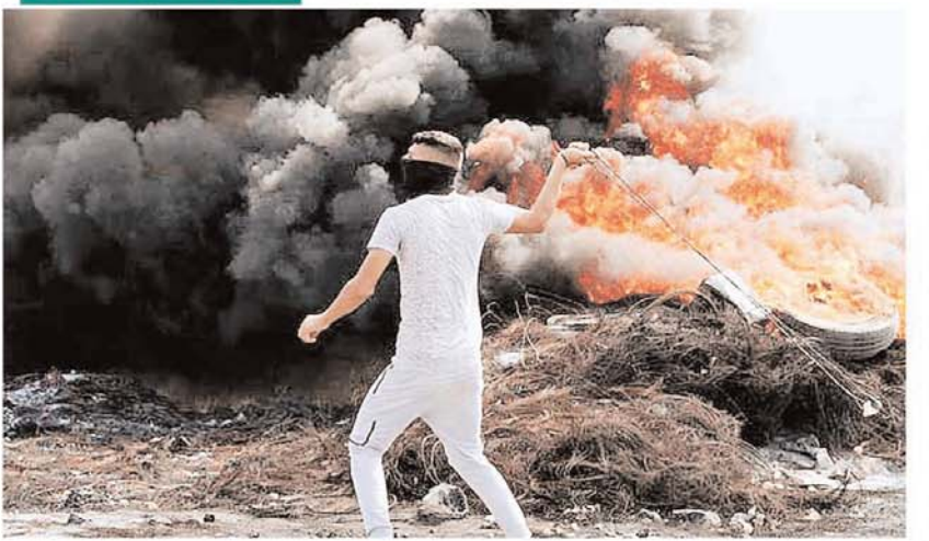
वेस्ट बैंक ऑफ नब्बस के पास कुफ कदूम गांव में यहूदी बस्तियों के विस्तार के विरोध में संपर्क तेज हो गया। इस दौरान इजरायली सैनिकों पर पथराव करने के लिए प्रदर्शनकारी गुलेल का उपयोग कर रहे हैं।