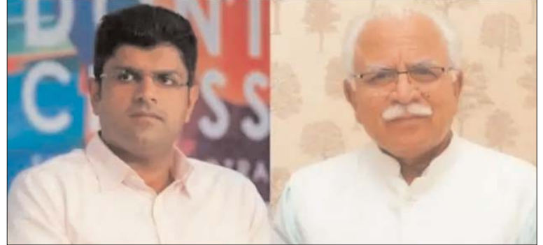
नेतृत्व वाली सरकार से हटने के लिए विपक्ष और हरियाणा के कुछ किसानों की ओर से दबाव का सामना कर रहे चौटाला ने कहा कि अगर न्यूनतम समर्थन मूल्य की व्यवस्था हम और हमारी पार्टी किसानों की चिंताओं को सरकार के सामने रख रहे हैं। उनकी अपनी ही पार्टी के विधायकों द्वारा प्रदर्शनकारी किसानों का समर्थन करने के बारे में पूछे जाने